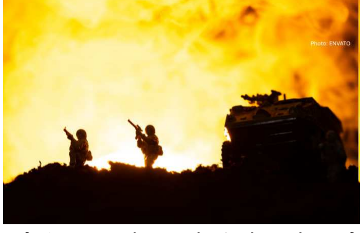
કાર્યવાહી હજુ પણ ચાલુ છે. ઈઝરાયલના વડાપ્રધાન બેન્જામિન નેતન્યાહુએ સ્પષ્ટ કર્યું છે કે સૈન્ય કાર્યવાહી ચાલુ રહેશે.

મિડલ ઈસ્ટમાં સતત શાંતિ વાતાઘાટો છતાં ઈઝરાયલ અને લેબેનોન વચ્ચે સંઘર્ષ વધી રહ્યો છે. આજે જ અમેરિકાના પ્રમુખ ડોનાલ્ડ ટ્રમ્પે જાહેરાત કરી હતી કે ઈઝરાયલ અને લેબેનોન એકબીજા પર હુમલા નહીં કરે પરંતુ વાસ્તવિકતા કંઈક જુદી જ છે. ટ્રમ્પના દાવા મુજબ, હિઝબુલ્લાહે હુમલા ન કરવાનું વચન આપ્યું છે અને ઈઝરાયલ બેરૂત પરના હુમલા અટકાવવા સહમત થયું છે. તેમ છતાં, દક્ષિણ લેબનાનમાં સૈન્ય