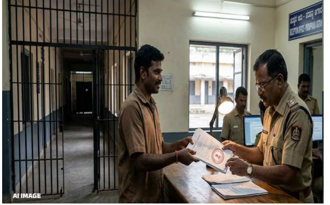
૧૩ નવેમ્બર ૨૦૧૮ના રોજ શંકરે જેલ સત્તાવાળાઓ સમક્ષ સુપ્રીમ કોર્ટના રાહત આપતા નકલી દસ્તાવેજો રજૂ કર્યા હતા. આ કથિત કોર્ટ ઓર્ડર સાથે જોડાયેલો ૧૦,૦૦૦ રૂપિયાનો

કેદની સજા કાપી રહેલો એક પાકો ગુનેગાર આશરે ૮ વર્ષ પહેલાં સુપ્રીમ કોર્ટના નકલી દસ્તાવેજોનો ઉપયોગ કરીને બેંગલુરુની પરપના અગ્રહારા સેન્ટ્રલ જેલમાંથી મુક્ત થઈ ગયો હતો. હવે આટલા વર્ષો પછી જ્યારે આ સમગ્ર કોબાંડનો પર્દાફાશ થયો છે, ત્યારે જેલ પ્રશાસનમાં ફફડાટ વ્યાપી ગયો છે.