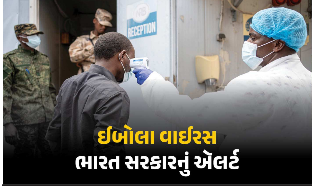
ઈબોલા વાઈરસ ભારત સરકારનું એલર્ટ

આફ્રિકાના કેટલાક ભાગોમાં 'બુન્ડીબુગ્યો સ્ટ્રેન'ના કારણે ફેલાયેલા ઈબોલાના પ્રકોપને ધ્યાનમાં રાખીને ભારત સરકારે પોતાના નાગરિકો માટે એક મહત્વની ટ્રાવેલ એડવાઈઝરી જાહેર કરી છે. સરકારે ભારતીયોને કાંગો, યુગાન્ડા અને દક્ષિણ સુદાનની બિનજરૂરી મુસાફરી ટાળવાની સલાહ આપી છે. વિશ્વ સ્વાસ્થ્ય સંગઠન (ડૉઈ) દ્વારા ૧૭ મેના રોજ આ સ્થિતિને આંતરરાષ્ટ્રીય ચિંતાની પબ્લિક હેલ્થ ઈમરજન્સી જાહેર કર્યા બાદ ભારત સરકાર