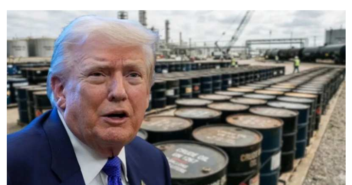
પુન:પુષ્ટિ આપી, કહ્યું કે, 'જે કંઈ માફી હોય કે ન હોય, તે અસર કરશે નહીં.'