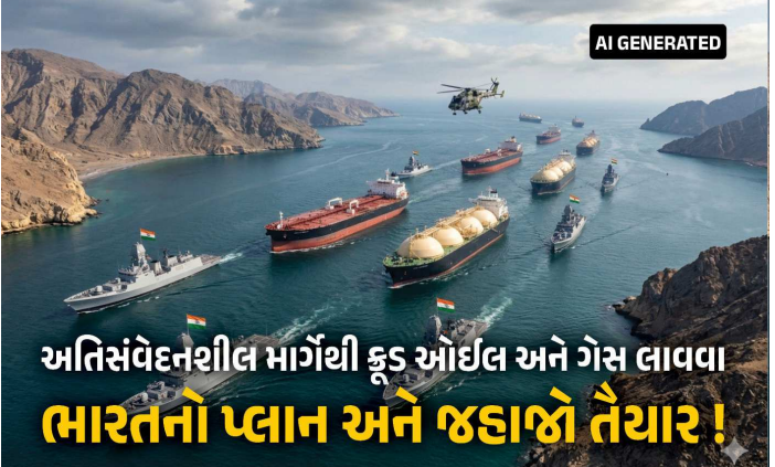
અતિસંવેદનશીલ માર્ગથી કૂડ ઓઈલ અને ગેસ લાવવા ભારતનો પ્લાન અને જહાજો તૈયાર!

અમેરિકા-ઈરાન વચ્ચે ભલે હોર્મુઝ જળમાર્ગ મામલે વિવાદ ચાલી રહ્યો હોય, તેમ છતાં ભારતે તે માર્ગ પરથી કૂડ ઓઈલ અને ગેસની સપ્લાય ચેન શરૂ કરવા માટે મોટી તૈયારીઓ શરૂ કરી છે. રિપોર્ટ મુજબ, ભારતે મધ્ય-પૂર્વમાંથી કાર્ગો લેવા માટે જહાજો મોકલવાનો પ્લાન લગભગ તૈયાર કરી લીધો છે. હવે માત્ર સરકારની અંતિમ મંજૂરીની રાહ જોવાઈ રહી છે, ત્યાર બાદ તે જહાજો હોર્મુઝમાંથી ખાડી તરફ રવાના થઈ શકે છે. મીડિયા રિપોર્ટ મુજબ, ઈરાન યુદ્ધ શરૂ થયા બાદ હોર્મુઝ જળમાર્ગ ખૂબ જ સંવેદનશીલ થઈ ગયો છે, તેમ છતાં ભારતે ત્યાંથી મોટા પ્રમાણમાં સપ્લાય શરૂ કરવાના પ્રયાસો શરૂ કરી દીધા છે. વિશ્વભર માટે હોર્મુઝ ખૂબ જ મહત્વનો જળમાર્ગ છે, ત્યાંથી અનેક દેશોમાં કૂડ ઓઈલ, ગેસ સહિતની મોટાપાયે સપ્લાય થાય છે.