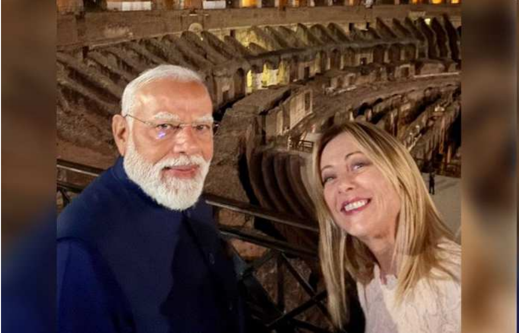
પીએમ મોદી પોતાના પાંચ દેશોના મહત્વના યુરોપીય પ્રવાસના અંતિમ યરણમાં મંગળવાર સાંજે ઈટાલી પહોંચી ગયા છે, જ્યાં તેમનું ભવ્ય સ્વાગત કરવામાં આવ્યું હતું. ઈટાલીના વડાપ્રધાન જોર્જિયા મેલોનીના ખાસ આમંત્રણ પર યોજાયેલો

આ પ્રવાસ બંને દેશોની વ્યૂહનીતિ અને કૂટનીતિક સંબંધો માટે અત્યંત ખાસ છે, કારણ કે પીએમ મોદીની આ પ્રથમ સત્તાવાર ઈટાલીની દ્વિપક્ષીય યાત્રા છે. રોમ પહોંચતાની સાથે જ પીએમ જોર્જિયા મેલોનીએ સોશિયલ મીડિયા પર પીએમ મોદી સાથે એક શાનદાર સેલ્ફી શેર કરી હતી. આ ફોટોના કેપ્શનમાં તેમણે લખ્યું, 'રોમમાં તમારું સ્વાગત છે, મારા મિત્ર!' અને જો તેજોતામાં આ તસવીર ઈન્ટરનેટ પર વાઈરલ થઈ ગઈ છે. આ પ્રથમ વખત નથી જ્યારે આ બંને નેતાઓની સેલ્ફી વાઈરલ થઈ હોય. આ પહેલાં વર્ષ ૨૦૨૩માં દુબઈમાં યોજાયેલી ઝૂંટ સમિટ