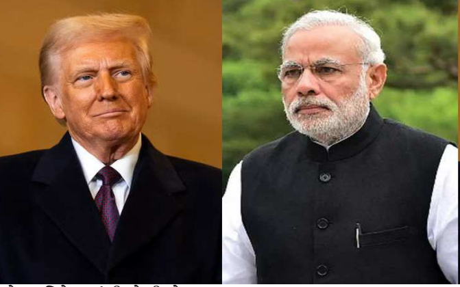
દેશોના વિદેશ મંત્રીઓની બેઠક દરમિયાન ભારતના વિદેશ મંત્રી ડો. એસ. જયશંકર અને ફ્રાન્સના યુરોપ તથા વિદેશી બાબતોના મંત્રી જીન-નોએલ વચ્ચે એક મહત્વપૂર્ણ દ્વિપક્ષીય બેઠક યોજાઈ હતી. ફ્રાન્સની સત્તાવાર રિલીઝ અનુસાર, 'બંને મંત્રીઓએ એ વાતને આવકારી છે કે વડાપ્રધાન મોદીએ ઈવિયન શિખર સંમેલન (ઈઈઈકઝ) માં પોતાની ભાગીદારીની પુષ્ટિ કરી દીધી છે. આ બાબતને ધ્યાનમાં રાખીને ૨૭ ના કાર્ય અને વૈશ્વિક નિર્ણયોમાં ભારતના અમૂલ્ય યોગદાન પર ભાર મૂકવામાં આવ્યો હતો. આ પ્રવાસની સૌથી મોટી અને મહત્વની વાત એ છે કે, આ સમિટ દરમિયાન પીએમ મોદી અને અમેરિકી પ્રમુખ ડોનાલ્ડ ટ્રમ્પ વચ્ચે દ્વિપક્ષીય મુલાકાત યોજાય તેવી પ્રબળ સંભાવના છે. છેલ્લા

શિખર સંમેલનમાં વડાપ્રધાન નરેન્દ્ર મોદીની સહભાગિતા અને પ્રમુખ ડોનાલ્ડ ટ્રમ્પ સાથેની સંબંધિત મુલાકાતને લઈને મોટા રાજદ્વારી સમાચાર સામે આવ્યા છે. વૈશ્વિક સ્તરે ભારતની વધતી જતી આર્થિક અને રાજદ્વારી તાકાતનો પુરાવો ફરી એકવાર જોવા મળ્યો છે. આગામી ૧૫ થી ૧૭ જૂન દરમિયાન ફ્રાન્સમાં યોજાનારા પ્રતિષ્ઠિત ૨૭ શિખર સંમેલનમાં ભાગ લેવા માટે વડાપ્રધાન નરેન્દ્ર મોદી ફ્રાન્સની સત્તાવાર મુલાકાતે જવાના છે. ફ્રાન્સના વિદેશ મંત્રાલયે સત્તાવાર પ્રેસ રિલીઝ જારી કરીને વડાપ્રધાન મોદીની આ ઉચ્ચ સ્તરીય સંમેલનમાં સહભાગિતાની પુષ્ટિ કરી છે. તાજેતરમાં ફ્રાન્સના 'છબ્બકઝી ફ્રીજ ફક્ટેટ-ક્લી-ઝીડિક્ઝ' ખાતે યોજાયેલી ૨૭