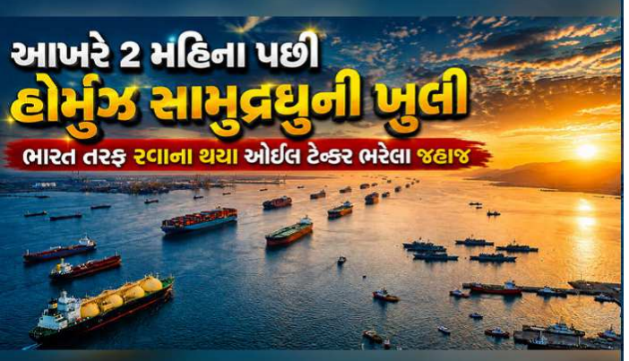
આખરે 2 મહિના પછી હોર્મુઝ સામુદ્રધુની ખુલી ભારત તરફ રવાના થયા ઓઈલ ટેન્કર ભરેલા જહાજ

મધ્ય-પૂર્વમાં લાંબા સમયથી ચાલી રહેલા યુદ્ધનો અંત આવતાં આખરે વૈશ્વિક અર્થતંત્ર અને ઊર્જા બજાર માટે રાહતના સમાચાર આવ્યા છે. અમેરિકા તથા ઈરાન વચ્ચે થયેલા શાંતિ કરારની જાહેરાત બાદ હોર્મુઝની સામુદ્રધુની (સ્ટ્રેટ ઓફ હોર્મુઝ) પરથી બે મહિનાથી લાગેલી યુએસ નૌકાદળની નાકાબંધી હટાવી દેવામાં આવી છે. આ સાથે જ ઈરાની ઓઈલ ફરીથી વૈશ્વિક બજારમાં વહેવા લાગ્યું છે, જેના