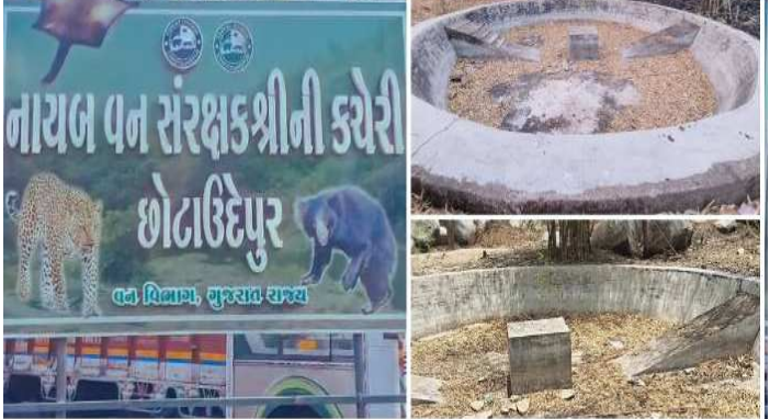
પાણી વગર તરસતા રીંછ અને દીપડા રહેણાંક વિસ્તાર તરફ ધસી આવે તેવી ભીતિ

સમગ્ર વિશ્વ અત્યારે ગ્લોબલ વોર્મિંગની ગંભીર સમસ્યા સામે ઝૂમી રહ્યું છે અને કાળજાળ ઉનાળાની આકરી ગરમી પડી રહી છે, ત્યારે છોટાઉદેપુર જિલ્લાના કદવાલ અને કુંડલ તાલુકામાં આવેલા ચેથાપુરના જંગલ વિસ્તારમાંથી અબોલ વન્યજીવોની અત્યંત દયનીય પરિસ્થિતિ સામે આવી છે. વન્યપ્રાણીઓ પોતાની તરસ છિપાવી શકે તે માટે વન વિભાગ દ્વારા બનાવવામાં આવેલા મોટા કોંક્રિટના પાણીના કેટલાક હવાડા લાંબા સમયથી તદ્દન ખાલીખમ અને સૂકાબદ્ધ છે. પાણી વિનાના આ ખાલીખમ હવાડાના દ્રશ્યો વન વિભાગની ધોર બેદરકારી છતી કરે છે. પાણીના એક-એક ટીપાં માટે વલખાં મારતા વન્યજીવો સૂકું ઘાસ અને વાંસના ઝુંડ ધરાવતા આ ડુંગરાળ તેમજ પથરાળ જંગલ વિસ્તારમાં રીંછ, દીપડા, રોઝ (નીલગાંધ્ય) અને અન્ય નાના-મોટા અસંખ્ય જંગલી પ્રાણીઓ વસવાટ કરે છે. કાળજાળ