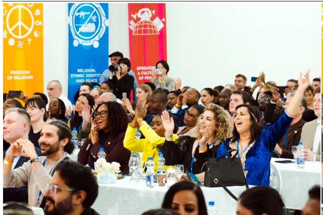
Frankfurt, Germany Hosts "Peace City Gala Night" "European Religious Leaders Step Forward to Resolve Conflict Through a Declaration on Peace and Mutual Respect"