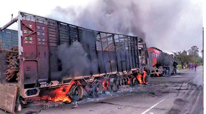
મોબાઈલ ડેટા સર્વિસ થોડા સમય માટે અટકાવી દીધી હતી. જ્યારે ચાર જિલ્લામાં કરફ્યું લદાયો હતો. રિપોર્ટમાં જણાવવામાં આવ્યું હતું કે વિષ્ણુપુર જિલ્લાના મોઈરાંગ ટ્રોંગલાઓબી વિસ્તારમાં રાત્રે એક વાગ્યે શંકાસ્પદ ઉગ્રવાદીઓએ બોમ્બ ફેંકતા પાંચ વર્ષના યુવક અને છ મહિલાની બાળકોનું મોત નિપજ્યું હતું. આ ધમાકો એટલો વિકરાળ હતો કે જે રૂમમાં બાળક અને તેની માતા ઉઠી રહ્યા હતા તેનો નાશ પામ્યો હતો. બોમ્બ બ્લાસ્ટના મામલાની તપાસ એનઆઈએને સોંપવા રાજ્ય સરકારે નિર્ણય લીધો છે. ઘર પર બોમ્બ બ્લાસ્ટને પગલે સમગ્ર વિસ્તારના નાગરિકોમાં ભય ફેલાયો છે, પરિણામે મોટી સંખ્યામાં લોકો રસ્તા પર ઉતર્યા હતા અને ચક્કાજમ કર્યો હતો. એટલું જ નહીં બે ફૂડ ઓઈલ ટેન્કરો અને એક ટ્રક સહિત અનેક વાહનોને ટોળાએ આગ લગાવી દીધી હતી.

મણિપુરમાં ફરી હિંસા ભડકી હતી, વિષ્ણુપુર જિલ્લામાં સોમવારે રાત્રે કેટલાક શંકાસ્પદ ઉગ્રવાદીઓએ રોકેટ અને મિસાઈલો સાથે હુમલો કર્યો હતો. જેમાં બે બાળકોના મોત નિપજ્યા હતા. જ્યારે તેમની માતા ગંભીર રીતે ઘાયલ થઈ હતી. આ ઘટના બાદ સમગ્ર વિસ્તારમાં ઉગ્ર વિરોધ પ્રદર્શનો થવા લાગ્યા હતા અને હિંસા ભડકી ઉઠી હતી. ટોળાને વિખેરવા માટે બાદમાં સુરક્ષાદળ દ્વારા ગોળીબાર કરવામાં આવ્યો હતો જ્યારે પ્રશાસને ચાર જિલ્લામાં કરફ્યું લાગુ કર્યો હતો. સુરક્ષાદળો દ્વારા કરાયેલા આ ગોળીબારમાં અનેક પ્રદર્શનકારીઓ ઘાયલ થયા હતા. જેથી હિંસાએ ઉગ્ર સ્વરૂપ ધારણ કર્યું હતું. પરિસ્થિતિને ધ્યાનમાં રાખીને ઈન્ફાલ, કાકચિંગ, વિષ્ણુપુર સહિત પાંચ જિલ્લામાં ઈન્ટરનેટ અને