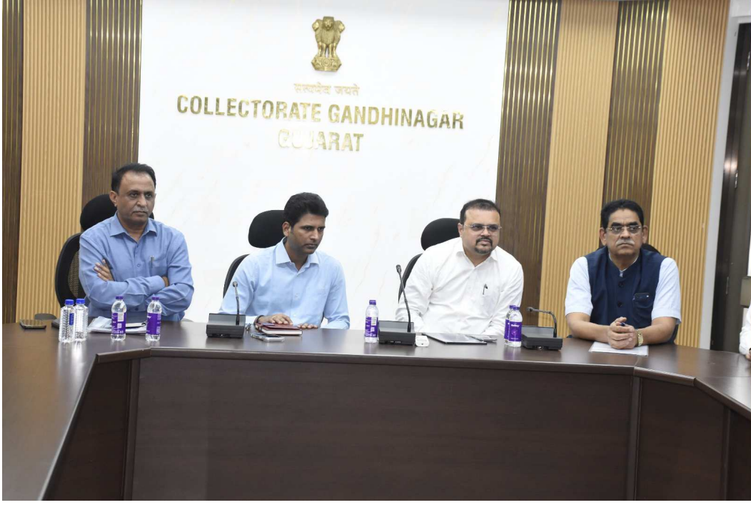
રાજ્યના વન પર્યાવરણ સચિવ શ્રી ડો.વિનોદ રાવની અધ્યક્ષતામાં કલેક્ટર કચેરી ખાતે ગાંધીનગર જિલ્લાના પ્રભારી અધ્યક્ષતામાં કલેક્ટર કચેરી ખાતે સચિવ શ્રી રાવએ સિમેન્ટલેસ તળાવ અને ધનિષ્ઠ વનીકરણ તથા ભૂગર્ભજળ સંગ્રહ પર ભાર મૂકી કુદરતી અને પ્રાકૃતિક પદ્ધતિના ઉપયોગ થકી

પ્રેઝન્ટેશન થકી જિલ્લાના વિકાસ કાર્યોની વિસ્તૃત વિગતો રજૂ કરવામાં આવી હતી. આ બેઠકમાં સચિવશ્રીએ વિશેષતમ જળ વ્યવસ્થાપન, જિલ્લાના દરેક વિસ્તાર સુધી પાણી પહોંચાડવાની વ્યવસ્થા, તળાવોના રિ-ડેવલપમેન્ટ, તેના થકી ભૂગર્ભ જળ ક્ષમતામાં વધારો અને અલ્ટરનેટિવ રિવરફ્રન્ટ કોન્સેપ્ટ અંગે વિશેષ ચર્ચા કરી હતી. આ સાથે તેમણે જિલ્લામાં સામાજિક વનીકરણ દ્વારા ગ્રીન કવર વધારવાના નવીનતમ પ્રયાસો માટે મહત્વના સૂચનો કર્યા હતા. સચિવ શ્રી રાવએ સિમેન્ટલેસ તળાવ અને ધનિષ્ઠ વનીકરણ તથા ભૂગર્ભજળ સંગ્રહ પર ભાર મૂકી કુદરતી અને પ્રાકૃતિક પદ્ધતિના ઉપયોગ થકી