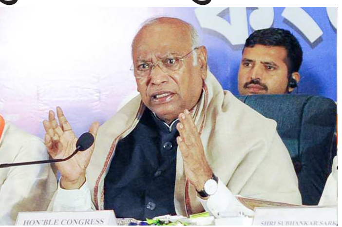
'કેરલમમાં તાજેતરમાં આપેલા મારા એક ચૂંટણી પ્રવચનની કેટલીક ટિપ્પણીઓને જાણીજોઈને ખોટી રીતે રજૂ કરવામાં આવી રહી છે. તેમ છતાં, હું મારી નિષ્ઠાપૂર્વક દિલગીરી વ્યક્ત કરું છું. ગુજરાતના લોકો પ્રત્યે મને હંમેશા સર્વોચ્ચ આદર રહ્યો છે અને ભવિષ્યમાં પણ રહેશે. ત્યાંના લોકોની લાગણી દુભાવવાનો મારો ક્યારેય કોઈ હેતુ નહોતો. ગત ૫ એપ્રિલે ચૂંટણી સભામાં ખડગેએ કહ્યું હતું કે, 'કેરલમના લોકોને ગેરમાર્ગે દોરશો નહીં. તેઓ ખૂબ જ હોશિયાર છે, તેઓ શિક્ષિત છે. મોદીજી, વિજયન (કેરલમના મુખ્યમંત્રી પિનારાયી વિજયન), તમે બંને એવા લોકોને મૂર્ખ બનાવી શકો છો જેઓ ગુજરાતમાં કે અન્ય સ્થળોએ અભણ છે, પરંતુ તમે કેરલમના લોકોને મૂર્ખ બનાવી શકતા નથી. કેરલમના લોકો માત્ર કેરલમમાં જ નહીં, પરંતુ સમગ્ર વિશ્વમાં ફેલાયેલા છે. તેઓ કામ કરી રહ્યા છે અને ભારતને પૈસા મોકલી રહ્યા છે.'

કેરલમ વિધાનસભા ચૂંટણી માટે આગામી ૯ એપ્રિલ, ૨૦૨૬ના રોજ મતદાન યોજાશે. ત્યારે રાજકીય પક્ષો દ્વારા કેરલમમાં ચૂંટણી પ્રચારનો ધમધમાટ શરૂ કરી દેવાયો છે. ત્યારે ગત ૫ એપ્રિલે કેરલમમાં ચૂંટણી પ્રચાર દરમિયાન કોંગ્રેસના રાષ્ટ્રીય પ્રમુખ મલ્લિકાર્જુન ખડગેએ વિવાદાસ્પદ નિવેદન આપ્યું હતું. કેરલમના ચૂંટણી પ્રચાર દરમિયાન ખડગેએ ગુજરાતીઓને અશિક્ષિત-અભણ ગણાવ્યા હતા. તેમણે કહ્યું કે, 'મોદીજી ગુજરાતની અભણ પ્રજાને મૂર્ખ બનાવી શકે, કેરલમની નહીં...' આ નિવેદનની ગુજરાતીઓ અને ભાજપ-આપ સહિતના રાજકીય પક્ષો અને આગેવાનો દ્વારા ભારે ટીકા કરવામાં આવી રહી છે. ત્યારે હવે ખડગેએ પોતાના નિવેદન પર માફી માગી છે. તેમણે આજે સોશિયલ મીડિયા પ્લેટફોર્મ 'X' પર પોસ્ટ કરીને લખ્યું કે,