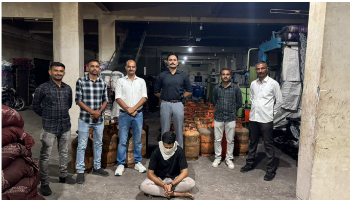
પ્રાપ્ત વિગતો અનુસાર, જેતપુરના વાસુકી ઉદ્યોગનગરમાં આવેલ 'ખેતલીયા ટેક્સટાઈલ' નામના સાડીના કારખાનામાં મશીનમાં ઉપયોગમાં લેવા માટે

રાજકોટ જિલ્લાના જેતપુરમાં કોમર્શિયલ ગેસ સિલિન્ડરની ગેરકાયદેસર સંગ્રહખોરી પર સ્પેશિયલ ઓપરેશન ગ્રુપ (જીએ) એ તવાઈ બોલાવી છે. ભાદર નદીના સામા કાંઠે આવેલા વાસુકી ઉદ્યોગનગરમાં ચાલતા સાડીના એક કારખાનામાં દરોડો પાડીને પોલીસે અલગ-અલગ કંપનીઓના કુલ ૯૩ જેટલા ગેસ સિલિન્ડર જપ્ત કર્યા છે અને સખ્લાય કરનાર એજન્સીને સીલ મારી કડક કાર્યવાહી હાથ ધરી છે.