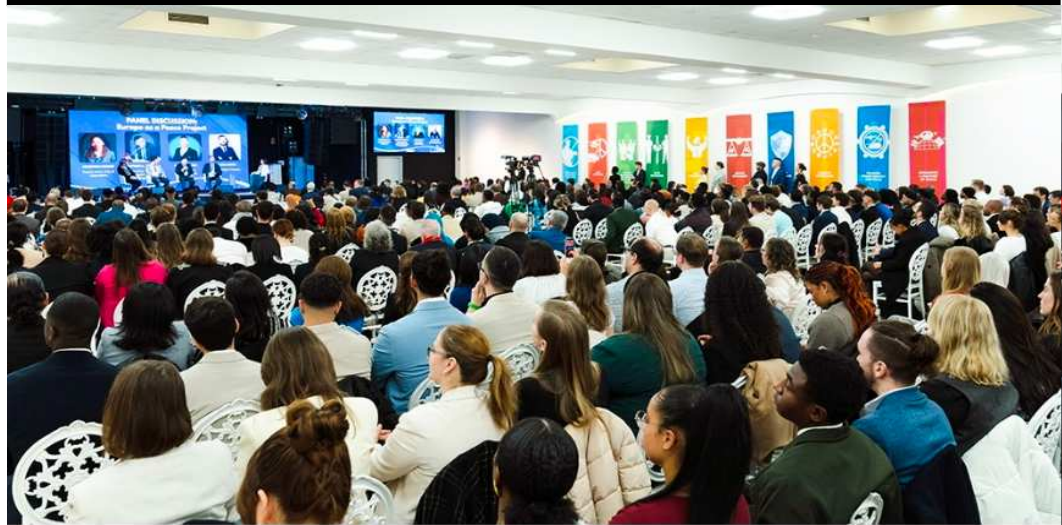
"Peace City Gala Night - First European Edition" Held "On December 18, 2025, the HWPL Frankfurt Branch in Germany hosted the "Peace City Gala Night - First European Edition" in Frankfurt under the theme, "The Role of Leaders in Building a Peaceful and Healthy Society Amid Crisis." The event brought together more than 600 participants and introduced a city-based peace model that integrates municipal leadership, religious responsibility, civil society participation, youth empowerment, and international law advocacy into a unified framework. The Peace City initiative aims to connect the ideals of peace with institutional commitments and active civic engagement, encouraging practical peacebuilding within communities.