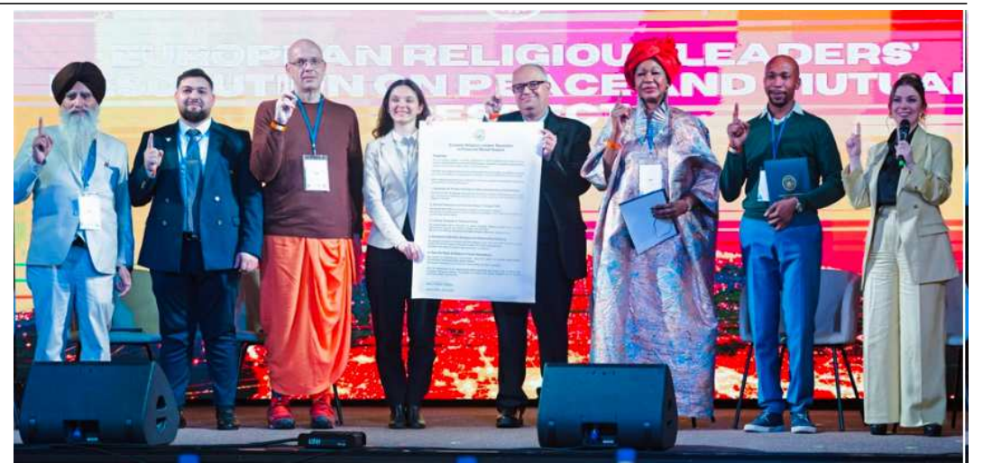
The gala served as the grand finale of three Peace City Nights held in Frankfurt. A total of 607 participants attended the event, including leaders from the fields of politics, religion, youth, NGOs, education, and media, along with representatives from various European countries. "Proclamation of the "European Religious Leaders' Declaration on Peace and Mutual Respect"" "Pan-European Religious Leaders' Conference Brings Together Seven Religions"" "Prior to the gala, a Pan-European Religious Leaders' Conference was held, bringing together representatives from Islam, Christianity, Hinduism, Sikhism, Yazidism, Judaism, and Buddhism. During the conference, 27 religious leaders signed the "European Religious Leaders' Declaration on Peace and Mutual Respect," affirming the responsibility of religion to promote reconciliation and uphold human dignity.

અંગેની વિવિધ પ્રવૃત્તિઓ યોજવામાં આવી હતી. જેમાં ચિત્ર સ્પર્ધા, નિબંધ સ્પર્ધા, વક્તૃત્વ સ્પર્ધા, શપથ વિધિ જેવા કાર્યક્રમો યોજાયા હતાં જેમાં મતદાન માટે જાગૃત કરવા શાળાના વિદ્યાર્થીઓ દ્વારા મતદાન જાગૃતિની રેલી યોજવામાં આવી હતી. જેમાં વિદ્યાર્થીઓએ હાથમાં સંદેશ આપતા બેનરો અને પ્લેકાર્ડ પકડી ગ્રામજનોને મતદાન માટે પ્રેરિત કર્યા હતાં. આ પ્રસંગે શાળાના આચાર્યશ્રીએ જણાવ્યું હતું કે, યુવા પેઢીએ લોકશાહીના પાયા સમાન છે. વિદ્યાર્થીઓએ પોતાના પરિવાર અને આસપાસના લોકોને મતદાન માટે પ્રેરિત કરે તે ખૂબ જ જરૂરી છે.