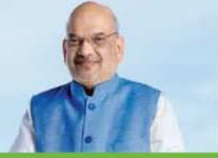
માનનીય કેન્દ્રીય ગૃહ અને સહકારિતા મંત્રી શ્રી અમિત શાહ જી

માનનીય પ્રધાનમંત્રી શ્રી નરેન્દ્ર મોદી જી અને માનનીય કેન્દ્રીય ગૃહ તથા સહકારિતા મંત્રી અમિત શાહ જી ના માર્ગદર્શન હેઠળ નૈનો ખાતર દ્વારા થઈ રહી છે ભારતીય કૃષિ મજબૂત