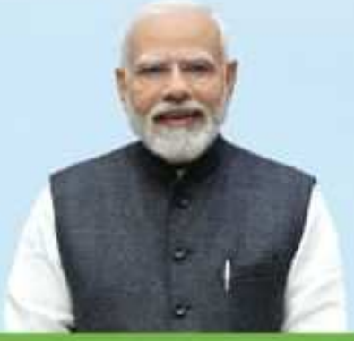
માનનીય પ્રધાનમંત્રી શ્રી નરેન્દ્ર મોદી જી

IFFCO પૂર્ણતઃ સહકારી સ્વામિત્વ Wholly owned by Cooperatives