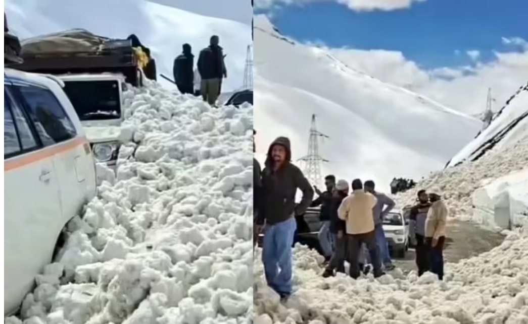
બચાવ કામગીરી શરૂ કરવા નિર્દેશ આપ્યો છે. આપત્તિ રાહત ઘણો અને શ્રીનગર-લેહ નેશનલ હાઈવે પર હિમપ્રપાતને કારણે ૭નાં મોત

લદાખ, જમ્મુ-કાશ્મીરમાં શુક્રવારે શ્રીનગર-લેહ નેશનલ હાઈવે પર અનેક સ્થળોએ હિમપ્રપાત થવાને કારણે વાહનો તેની ઝપેટમાં આવી ગયા હતા. આ દુર્ઘટનામાં એક બાળક અને બે મહિલાઓ સહિત સાત લોકોનાં મોત થયા છે, અન્ય પાંચ લોકો ઘાયલ થયા છે. કેન્દ્રશાસિત પ્રદેશો જમ્મુ-કાશ્મીર અને લદાખને જોડતા નેશનલ હાઈવે પર ઝોજિલા પાસ પાસે 'ઝીરો પોઈન્ટ' અને 'મિનિમાર્ગ' વચ્ચેના વિસ્તારમાં આ હિમપ્રપાત થયો હતો. બપોરના સમયે વાહનો આ ઊંચાઈવાળા વિસ્તારમાંથી પસાર થઈ રહ્યા હતા, ત્યારે અચાનક ભરફના મોટા જથ્થા નીચે ધસી આવ્યા હતા, જેમાં અનેક વાહનો ટટાઈ ગયા હતા. ઘટના બાદ તરત જ વિવિધ એજન્સીઓ દ્વારા સંયુક્ત બચાવ કામગીરી શરૂ કરવામાં આવી હતી. ગંદરબલના સિનિયર સુપરિન્ટેન્ડેન્ટ ઓફ પોલીસ ખલીલ પોસવાલાે જણાવ્યું કે ત્રણ વાહનો હિમપ્રપાતની ઝપેટમાં આવ્યા હતા. જોકે બચાવ ટીમ પહોંચી ગઈ છે અને તેણે કામગીરી આરંભીને ફસાયેલાઓને બચાવી લેવા પ્રયાસો હાથ ધર્યાં છે. લદાખના લેફ્ટનન્ટ ગવર્નર વિનય કુમાર સક્સેનાએ જણાવ્યું હતું કે તેમણે સ્થાનિક સત્તાધીશોને તાત્કાલિક પગલાં લેવા સૂચના આપી છે. તેમણે 'X' પર એક પોસ્ટમાં તેમણે હતું કે, "જોજીલા પાસે હિમપ્રપાતના દુર્ભાગ્યપૂર્ણ સમાચાર મળ્યા છે. મેં કારગિલના DC અને SSPને તાત્કાલિક ઘટનાસ્થળની મુલાકાત લેવા અને રાહત તેમજ