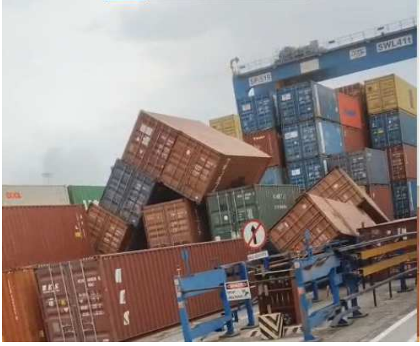
ગુજરાતના વાતાવરણમાં આવેલા અચાનક પલટાએ ખેડૂતો અને સામાન્ય જનજીવનને

મુશ્કેલીમાં મૂકી દીધું છે. હવામાન વિભાગની આગાહી વચ્ચે રાજ્યના કચ્છ, અમદાવાદ,