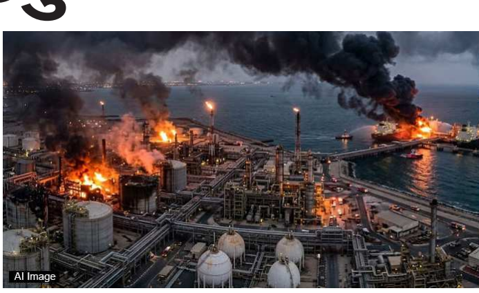
ભીષણ આગ લાગી છે અને કતાર એનર્જીએ તેનું ઉત્પાદન હાલ પૂરતું રોકી દેવાની ફરજ પડી છે. ઈરાને માત્ર કતાર જ નહીં, પરંતુ સાઉદી એરેબિયા અને યુએઈને પણ ચેતવણી આપી છે કે જો તેઓ અમેરિકા-ઈઝરાયેલને સાથ

પશ્ચિમ એશિયામાં ચાલી રહેલું ઈરાન અને ઈઝરાયેલ-અમેરિકા વચ્ચેનું યુદ્ધ હવે એક અત્યંત ખતરનાક વળાંક પર પહોંચી ગયું છે. અત્યાર સુધી માત્ર સૈન્ય ટેકાણાઓ પર થતા હુમલા હવે ઊર્જા ક્ષેત્રના ઈન્ફ્રાસ્ટ્રક્ચર (ઈન્ફ્રાસ્ટ્રક્ચર) પર થવા લાગ્યા છે. ઈરાને પોતાના સાઉથ પાર્સ ગેસ ફિલ્ડ પર થયેલા ઈઝરાયેલી હુમલાનો બદલો લેવા માટે કતારના અત્યંત મહત્વના 'રાસ લફાન ઈન્ડસ્ટ્રીયલ સિટી' પર હુમલો કર્યો છે. આ હુમલાને કારણે કતારના લિક્વિફાઈડ નેચરલ ગેસ (ન્દ્ર) પ્લાન્ટમાં