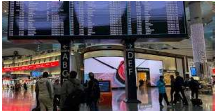
૨૦૨૬ પછી ઓવરસ્ટેટ્સ માટે દંડ માફ કરવામાં આવશે. કોન્સુલેટે ઉમેર્યું હતું કે મુસાફરી વિક્ષેપથી પ્રભાવિત વિદેશી નાગરિકોને એકિઝટ પરમિટ મફતમાં આપવામાં આવશે જેથી તેઓ રૂટ ફરી ખુલ્યા પછી ભારત છોડી શકે. અધિકારીઓએ સ્પષ્ટતા કરી હતી કે આ સમયગાળા દરમિયાન વિઝા એક્સટેન્શન અથવા એકિઝટ પરમિટ માટે અરજી કરવામાં નિષ્ફળતાને ઈમિગ્રેશન નિયમોનું ઉલ્લંઘન ગણવામાં આવશે નહીં, પ્રાદેશિક સંઘર્ષ દ્વારા સર્જાયેલા અસાધારણ સંજોગોને સ્વીકારીને.

દુબઈ, મધ્ય પૂર્વમાં ચાલી રહેલા સંઘર્ષને કારણે મુસાફરીમાં વિઠેશીના કારણે દેશમાં ફસાયેલા વિદેશી નાગરિકો માટે ભારત એક મહિનાના વિઝા લંબાવવાની મંજૂરી આપશે અને ઓવરસ્ટેટ્સ માફ કરશે. ૬ પરની એક પોસ્ટમાં, દુબઈમાં ભારતના કોન્સુલેટ જનરલે જણાવ્યું હતું કે રાહત પગલાંનો હેતુ એવા મુસાફરોને મદદ કરવાનો છે જેઓ ભારત છોડી શકતા નથી કારણ કે ગલ્ફ ક્ષેત્રના ભાગોમાં ફ્લાઈટ્સ અને રૂટ પ્રભાવિત રહેલા છે. xપશ્ચિમ એશિયામાં ચાલી રહેલા વિકાસને કારણે ભારતમાં ફસાયેલા વિદેશીઓ માટે નિયમિત ભારતીય વિઝા અથવા ઈ વિઝાનો લંબાવવો અને ઓવરસ્ટેટ્સ માફ કરવો, x કોન્સુલેટ કામચલાઉ ઈમિગ્રેશન રાહતની જાહેરાત કરતા જણાવ્યું હતું. નિવેદન અનુસાર, તમામ પ્રકારના ભારતીય વિઝા અને ઈ-વિઝા જે સમાપ્ત થઈ રહ્યા છે અથવા ટૂંક સમયમાં સમાપ્ત થવાના છે તે કોઈપણ શુલ્ક વિના એક મહિના માટે લંબાવવામાં આવશે. અસરગ્રસ્ત પ્રવાસીઓ માટે કસ-દર-કેસના આધારે અધિકારક્ષેત્રના વિદેશી પ્રાદેશિક નોંધણી કાર્યાલયની કચેરીઓ દ્વારા આ વિસ્તરણ આપવામાં આવશે. અધિકારીઓએ એમ પણ કહ્યું કે પશ્ચિમ એશિયામાં વિકાસને કારણે ૨૮ ફેબ્રુઆરી,