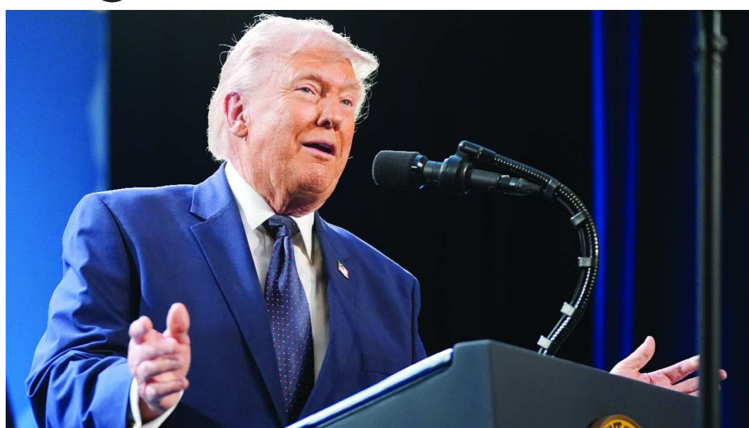
વોશિંગ્ટન, એક મહત્વપૂર્ણ ઘટનાક્રમમાં, યુએસ પ્રમુખ ડોનાલ્ડ ટ્રમ્પે શુક્રવારે કહ્યું કે યુએસ દળોએ ઈરાનના ખાર્ગ ટાપુ પર લશ્કરી લક્ષ્યોને 'નાશ' કરી દીધા છે અને ચેતવણી આપી હતી કે ત્યાં તેલ માળખાકીય સુવિધાઓ આગળ આવી શકે છે. પર્સિયન ગલ્ફમાં આવેલો આ નાનો ટાપુ પ્રાથમિક ટર્મિનલ છે જ્યાંથી ઈરાન તેલ નિકાસ કરે છે. ટ્રમ્પે

સમાહના અંતે ફ્લોરિડા જવાની તૈયારી કરતી વખતે સોશિયલ મીડિયા પોસ્ટમાં આ કાર્યવાહીની જાહેરાત કરી. એરફોર્સ વનમાં સવાર થતાં પહેલાં રાષ્ટ્રપતિએ તેમની સાથે મુસાફરી કરતા પત્રકારોના પ્રશ્નોના જવાબ આપ્યા, પરંતુ તેમણે ઈરાન સામેના તાજેતરના યુએસ લશ્કરી કાર્યવાહીનો ઉલ્લેખ કર્યો નહીં. આ દરમિયાન, યુએસ સૈન્યએ ૨,૫૦૦ મરીન, ઓછામાં ઓછું એક વધુ જહાજ મધ્યપૂર્વ મોકલ્યું છે, એક યુએસ અધિકારીએ ધ એસોસિએટેડ પ્રેસને જણાવ્યું. સંવેદનશીલ લશ્કરી યોજનાઓની ચર્ચા કરવા માટે નામ ન આપવાની શરતે બોલતા અધિકારીએ જણાવ્યું હતું કે ૩૧મી મરીન એક્સપિડિશનરી યુનિટ અને ઉભયજીવી હુમલો જહાજ યુએસએસ ત્રિપોલીના તત્વોને મધ્ય પૂર્વમાં મોકલવાનો આદેશ આપવામાં આવ્યો છે. આ પગલું પ્રદેશમાં સૈનિકોનો મોટો ઉમેરો દર્શાવે છે. ઈરાન શરણાગતિ સ્વીકારવા જઈ રહ્યું છે; ટ્રમ્પે યો નેતાઓને કહ્યું શુક્રવારે એક મીડિયા અહેવાલમાં જણાવ્યાં હતાં કે ટ્રમ્પે યો નેતાઓને કહ્યું હતું કે ઈરાન xશરણાગતિ સ્વીકારવા જઈ રહ્યું છે x, ઓપરેશન એપિક ફ્યુરીમાં સફળતાનો દાવો કર્યો હતો. એક્સિઓસના અહેવાલ મુજબ, ઈરાન સાથેના યુદ્ધના આર્થિક પરિણામો અંગે વધતી ચિંતાઓ વચ્ચે ટ્રમ્પે બુધવારે યો નેતાઓની વચ્ચે અલ મીટિંગ દરમિયાન આ દાવો કર્યો હતો. xમને એક કે નસરથી છુટકારો મળ્યો છે જે આપણા બધાને ધમકી આપી રહ્યો હતો, x ટ્રમ્પે નેતાઓને કહ્યું, જેમણે યુએસ રાષ્ટ્રપતિને યુદ્ધ ઝડપથી સમાપ્ત કરવા વિનંતી કરી. કોલ દરમિયાન, જર્મન ચાન્સેલર ફેડરિક મેર્ક, બ્રિટિશ વડા પ્રધાન કીર સ્ટારમર અને ફ્રેન્ચ રાષ્ટ્રપતિ ઈમેન્યુઅલ મેકોને ટ્રમ્પને વિનંતી કરી કે રશિયાને યુદ્ધનો લાભ લેવા અથવા પ્રતિબંધોમાં રાહત ન મળે, અહેવાલમાં બે અધિકારીઓને ટાંકીને જણાવ્યાં છે.