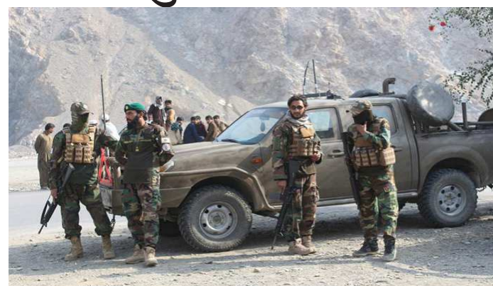
અહેવાલ છે. ઓક્ટોબર ૨૦૨૫ થી પાકિસ્તાન અને અફઘાનિસ્તાન વચ્ચેના સંબંધોમાં તીવ્ર બગાડ થયો છે, જે તેમની લાંબી વહેંચાયેલ સરહદ પર હુમલાઓ અને વળતા હુમલાઓ દ્વારા ચિહ્નિત થયેલ તીવ્ર અથડામણોમાં પરિણમ્યો છે. ઈસ્લામાબાદે બુધવારે જાહેરાત કરી હતી કે તેના સુરક્ષા દળોએ તાજેતરના લશ્કરી આક્રમણમાં ઓછામાં ઓછા ૬૪૧ અફઘાન તાલિબાન લડવેયાઓને માર્યાં છે અને ૮૫૫ થી વધુ ઘાયલ થયા છે. ઓપરેશન ગઝબ લિલ-હક નામનું આ અભિયાન ૨૬ ફેબ્રુઆરીએ શરૂ કરવામાં આવ્યું હતું જ્યારે અફઘાન તાલિબાન દળોએ ૨,૬૧૧ કિમી સરહદ પર ૫૩ સ્થળો પર હુમલો કર્યો હતો.

ઈસ્લામાબાદ, અફઘાન દળોએ પાકિસ્તાનના ઈસ્લામાબાદના ફેઝાબાદ વિસ્તારમાં xહમઝાx બેઝ તરીકે ઓળખાતા લશ્કરી મથકને નિશાન બનાવીને ડ્રોન હુમલો કર્યો હતો. સુરક્ષા સૂત્રોના જણાવ્યા અનુસાર, આ હુમલામાં ખાસ કરીને પાકિસ્તાનની રાજધાનીમાં લશ્કરી સ્થાપનને નિશાન બનાવવામાં આવ્યું હતું, ટોલો ન્યૂઝના અહેવાલો અનુસાર. જોકે, અધિકારીઓએ હજુ સુધી આ ઘટનાને કારણે થયેલા નુકસાન અથવા સંભવિત જાનહાનિ વિશે વિગતો જાહેર કરી નથી. તાલિબાને આ કાર્યવાહીની જવાબદારી સ્વીકારી છે, અને કહ્યું છે કે ડ્રોન હુમલાથી મધ્ય ઈસ્લામાબાદમાં હમઝા લશ્કરી મથક પર ભૌતિક નુકસાન અને જાનહાનિ બંને થયા છે. આ દાવાઓની સ્વતંત્ર ચકાસણી હજુ સુધી શક્ય બની નથી. અહેવાલો જણાવ્યા અનુસાર, પાકિસ્તાને સાવચેતીના પગલા તરીકે રાજધાની પર ફાઈટર જેટ ઉડાવ્યા. સ્થાનિક અહેવાલો પણ સૂચવે છે કે સુરક્ષા ચિંતાઓમાં વધારો થવાને કારણે ઈસ્લામાબાદ આંતરરાષ્ટ્રીય હવાઈમથક પર કામગીરી અસ્થાયી રૂપે સ્થગિત કરવામાં આવી હતી. અત્યાર સુધી, પાકિસ્તાની અધિકારીઓએ કથિત હડતાલ અથવા તાલિબાનના દાવાઓ અંગે કોઈ ઓપ્યારિક નિવેદન જાહેર કર્યું નથી. પરિસ્થિતિ અસ્થિર રહે છે, સુરક્ષા દળોએ ઈસ્લામાબાદ અને તેની આસપાસ ઉચ્ચ સ્તરનું એલર્ટ જાળવી રાખ્યું હોવાના