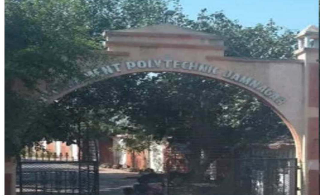
સારવાર કરાવ્યા બાદ આ મામલાને સીટી બી. ડિવિઝન પોલીસ મથકમાં લઈ જવાયો હતો. પોલીસ ફરિયાદમાં જાહેર કરાયા અનુસાર આજથી ૧૦ દિવસ પહેલા ઈજરાસ્ત અને હુમલાખોર બંને વિદ્યાર્થીઓ વચ્ચે બોલાચાલી થઈ હતી, જેમાં માર ખાનારે પોતાના સાથી પાસે માફી મંગાવી હતી. જે માફી માંગવાનું હુમલાખોરને પસંદ ન હતું, જેનું મનદુઃખ અને વેરભાવ રાખીને ઈજરાસ્ત જ્યારે પોતાના રૂમમાં વાંચી રહ્યો હતો.