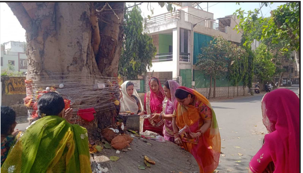
મારાવાડી સમાજની બહેનો ટાઢી સાતમ ના દિવસે પ્રહલાદ નગર વિસ્તારમાં આવેલ આનંદ નગર ફ્લેટમાં પિપળા ના ઝાડ પાસે બહેનો પુજા અર્ચના અને વ્રતનું વાંચન કરતા જોવા મળે છે

ખાડી દેશોમાં ભયંકર યુદ્ધ ચાલી રહ્યું છે તેવામાં ઈરાને ભારતને મોટી રાહત આપી છે. દુનિયામાં ફૂડ ઓઈલ અને ગેસની તંગ સ્થિતિ વચ્ચે મહત્વના સમુદ્રી માર્ગ સ્ટ્રેટ ઓફ હોમુઝમાં ભારતને સુરક્ષિત રસ્તો આપવાની ઈરાને તૈયારી દર્શાવી છે. ઈરાની રાજદૂત મોહમ્મદ ફતાલીએ કહ્યું છે કે, ઈરાન મહત્વપૂર્ણ દરિયાઈ માર્ગ હોમુઝ સ્ટ્રેટ દ્વારા ભારતને સુરક્ષિત માર્ગ પૂરો પાડવા માટે પગલાં લઈ શકે છે. આ નિવેદન બાદ આશા છે કે આગામી સમયમાં હોમુઝ સ્ટ્રેટ ફસાયેલા ભારતીય જહાજો સુરક્ષિત રીતે ભારતમાં ફૂડ અને ગેસ સપ્લાઈ કરી શકશે. ભારતમાં ઈરાનના રાજદૂત મોહમ્મદ ફતાલીએ ભારતને 'સુરક્ષિત માર્ગ' (જહૂકી ડુંજહૂકી) આપવાની ખાતરી આપતા જણાવ્યું હતું કે, 'ભારત અમારું ખાસ મિત્ર છે અને આગામી બે-ત્રણ કલાકમાં જ આ અંગેની પ્રક્રિયા જોવા મળશે. ભારત અને ઈરાન બંને સમાન હિતો ધરાવે છે, જેના કારણે બંને દેશો વચ્ચેનો સહયોગ પરસ્પર વિકાસ માટે અનિવાર્ય છે'. ઈરાન તરફથી મળેલી આ ખાતરી રાજદ્વારી અને વ્યૂહાત્મક દ્રષ્ટિએ ભારત માટે અત્યંત મહત્વની માનવામાં આવી રહી છે, જે યુદ્ધ વચ્ચે ક્ષેત્રીય સ્થિતિના અને વેપારના નવા દ્વાર ખોલી શકે છે. જો કે ઈરાની રાજદૂતે આ મુદ્દે વિસ્તારથી જાણકારી આપી નથી, પરંતુ આ નિવેદન એ બાબત પર ઈશારો કરે છે કે ભારત અને ઈરાન વચ્ચે સમુદ્રી અવરજવરને લઈને ગહન ચર્ચા ચાલુ છે જેનું સકારાત્મક પરિણામ આવી શકે.