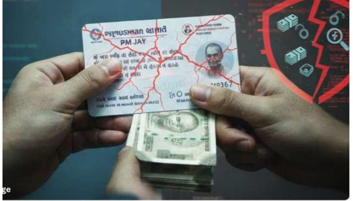
આ ફરિયાદો સાચી જણાતા વિભાગ દ્વારા સંબંધિત હોસ્પિટલોને નોટિસ ફટકારવામાં આવી હતી. નિયમ મુજબ, જે ખાનગી હોસ્પિટલો આયુષ્યમાન યોજના હેઠળ નોંધાયેલી છે, તેમણે દર્દીઓને ૧૦ લાખ રૂપિયા સુધીની સારવાર વિનામૂલ્યે આપવાની હોય છે. આ સારવારનો ખર્ચ સરકાર સીધો હોસ્પિટલોને ચૂકવે છે. આમ છતાં, કમાણીના મોહમાં આ હોસ્પિટલોએ દર્દીઓ પાસેથી વધારાના નાણાં વસૂલીને સરકારી નિયમોનું સરેઆમ ઉલ્લંઘન કર્યું છે. આરોગ્ય વિભાગે આ કસુરવાર હોસ્પિટલો પાસેથી કુલ ૩૯.૮૪ લાખ રૂપિયાનો દંડ વસૂલ કર્યો છે. જોકે, આટલા ગંભીર ગુના સામે માત્ર સામાન્ય દંડ વસૂલીને સંતોષ માનતા તંત્ર સામે પ્રકૃતિ પ્રેમીઓ અને જનતામાં રોષ જોવા મળી રહ્યો છે.