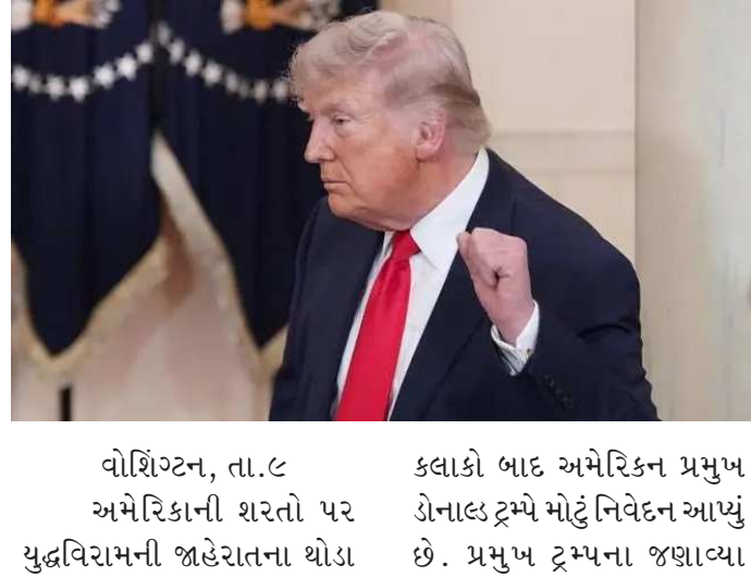
વોશિંગ્ટન, તા.૯ અમેરિકાની શરતો પર યુદ્ધવિરામની જાહેરાતના થોડા કલાકો બાદ અમેરિકન પ્રમુખ ડોનાલ્ડ ટ્રમ્પે મોટું નિવેદન આપ્યું છે. પ્રમુખ ટ્રમ્પના જણાવ્યા અનુસાર, ઈરાનમાં શાસન પરિવર્તનની પ્રક્રિયા અત્યંત ફળદાયી રહી છે અને હવે અમેરિકા ઈરાન સાથે મળીને કામ કરવા તૈયાર છે. તેમણે સ્પષ્ટ કર્યું છે કે ઈરાન હવે યુરેનિયમનું કોઈ સંવર્ધન કરી શકશે નહીં. ટ્રમ્પે પોતાના સોશિયલ મીડિયા પ્લેટફોર્મ ટુથ સોશિયલ પર લખ્યું કે, યુનાઈટેડ સ્ટેટ્સ ઈરાન સાથે મળીને નજીકથી કામ કરશે, જેમના વિશે અમે નક્કી કર્યું છે કે ત્યાં ખૂબ જ ફળદાયી શાસન પરિવર્તન થયું છે! યુરેનિયમનું કોઈ સંવર્ધન કરવામાં આવશે નહીં, અને યુનાઈટેડ સ્ટેટ્સ, ઈરાન સાથે મળીને, જમીનમાં ઊંડે દટાયેલી તમામ પરમાણુ xડસ્ટ (x-રે બોમ્બ્સ દ્વારા) ખોદીને બહાર કાઢશે અને હટાવશે. તે અત્યારે, અને પહેલા પણ, અત્યંત સચોટ સેટેલાઈટ

ટેખરેખ હેઠળ છે. હુમલાની તારીખથી કંઈપણ અડવામાં આવ્યું નથી. અમે ઈરાન સાથે ટેરિફ (જકાત) અને પ્રતિબંધોમાં રાહત અંગે વાતચીત કરી રહ્યા છીએ અને કરીશું. ૧૫ મુદ્દાઓમાંથી ઘણા મુદ્દાઓ પર પહેલેથી જ સહમતિ સંધાઈ ગઈ છે. આ બાબતે તમારા ધ્યાન બદલ આભાર. આ અગાઉ તેમણે લખ્યું હતું કે, જે દેશ ઈરાનને લશ્કરી શસ્ત્રો સપ્લાય કરશે, તેના પર યુનાઈટેડ સ્ટેટ્સ ઓફ અમેરિકામાં વેચાતા કોઈપણ અને તમામ સામાન પર તાત્કાલિક અસરથી ૫૦% ટેરિફ લાદવામાં આવશે. તેમાં કોઈ બાકાત કે મુક્તિ આપવામાં આવશે નહીં! આ સિવાય ટ્રમ્પે લિન્ડ્સે ગ્રેહામની પોસ્ટને રિશેર કરી છે. જેમાં લિન્ડ્સે ગ્રેહામને લખ્યું છે કે, મેં હમણાં જ પ્રમુખ સાથે ખૂબ જ સરસ વાતચીત કરી. ઈરાની શાસનને હોમુંક ખોલવા અને શાંતિ સમજૂતી કરવા માટે તેમણે જે અલ્ટીમેટમ આપ્યું છે, તેને હું સંપૂર્ણ સમર્થન આપું છું. જો ઈરાન નબળી પસંદગી કરશે તો તેમના પર મોટા પાયે લશ્કરી કાર્યવાહીની તૈયારી છે. ઓપરેશન એપિક ફ્યુરી દ્વારા આ શાસન ગંભીર રીતે કચડાઈ ગયું છે. આ પ્રદેશ અને સમગ્ર વિશ્વ વિરુદ્ધ તેમનું આતંકનું શાસન સમાપ્ત થવું જોઈએ, આશા છે કે શાંતિ સમજૂતી દ્વારા તે શક્ય બને. આજે સવારે પ્રમુખ ટ્રમ્પ સાથે વાત કર્યા પછી મને સંપૂર્ણ ખાતરી થઈ છે કે જો ઈરાન હોમુંકમાં અવરોધ કરવાનું ચાલુ રાખશે અને અમારા લશ્કરી ઉદ્દેશ્યો હાંસલ કરવા માટે રાજદ્વારી ઉકેલનો ઈનકાર કરશે, તો તેઓ શાસન સામે જબરદસ્ત સૈન્ય શક્તિનો ઉપયોગ કરશે. જો ઈરાન અને અન્યોને અત્યાર સુધી એ સ્પષ્ટ નથી થયું કે પ્રમુખ ટ્રમ્પ જે કહે છે તે કરે જ બંને પ્રથમ વિકેટ માટે માત્ર પાંચ ઓવરમાં ૮૦ રન જોડીને મુંબઈને બેકફૂટ પર ધકેલી દીધું.