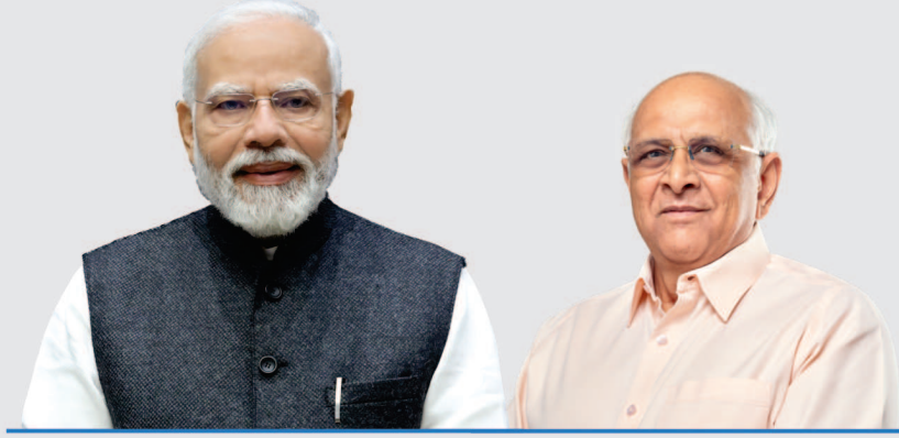
શ્રી નરેન્દ્ર મોદી માનનીય વડાપ્રધાન