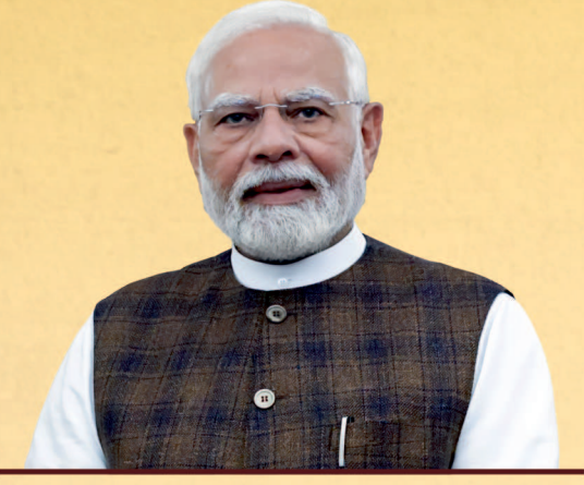
શ્રી નરેન્દ્ર મોદી માનનીય વડાપ્રધાન