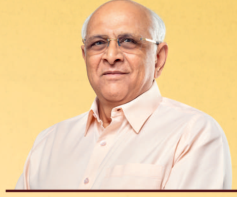
શ્રી ભૂપેન્દ્રભાઈ પટેલ માનનીય મુખ્યમંત્રી, ગુજરાત