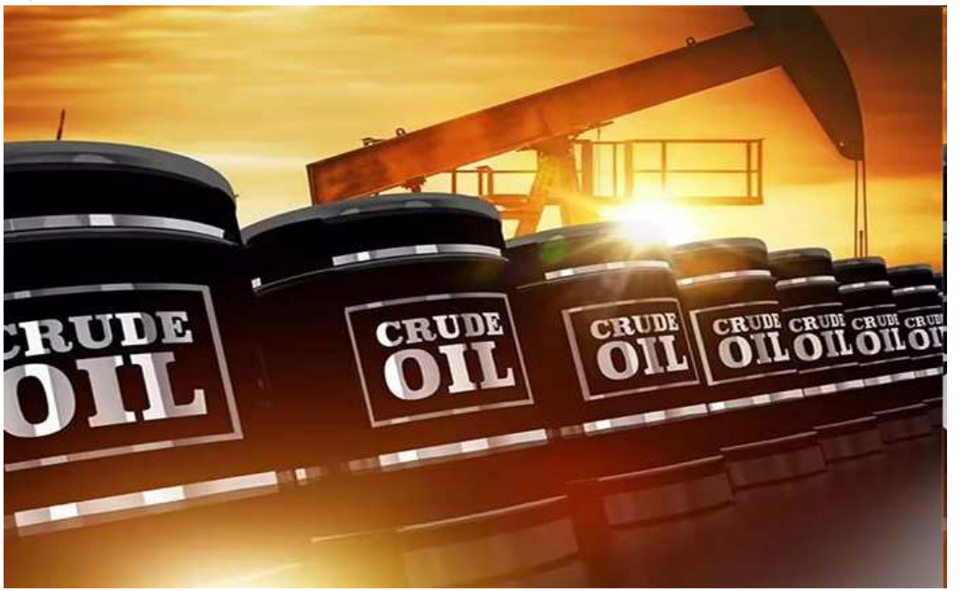
પ્રતિબંધ લાદવામાં આવવાના કારણે ભારતીય રીફાઈનરોએ અમેરિકા ભણી વળવું પડ્યું છે. આ ઉપરાંત અમેરિકામાંથી ફૂડ ઓઈલની આયાતમાં વધારાને બંને દેશ વચ્ચેના વેપાર સંબંધો સુધારવાના પ્રયત્ન તરીકે જોવામાં આવી રહ્યા છે. અમેરિકાએ ભારત પર ૫૦ ટકા ટેરિફ નાખ્યો છે.

આ ખરીદી પ્રતિ દિન ચાર લાખથી ૪.૫૦ લાખ બેરલ રહી શકે છે. આ આંકડો ગયા વર્ષની પ્રતિ દિન ત્રણ લાખ બેરલની સરેરાશ કરતાં વધારે છે. રશિયા પછી ઈરાક ભારતને ઓઈલ પુરવઠો પૂરો પાડવામાં બીજા ક્રમે આવે છે. તેના પછી ત્રીજા ક્રમે સાઉદી અરેબિયા આવે છે. સરકાર અને વેપારી વર્તુળોએ જણાવ્યું છે કે રિફાઈનરોએ યુએસ ગ્રેડ જેવા કે મિડલેન્ડ ડબલ્યુટીઆઈ અને માર્સ પાસેથી બુકિંગ્સ વધાર્યું છે, જેથી ફૂડ ઓઈલના પુરવઠામાં વૈવિધ્યતા લાવી શકાય, તેની સાથે વોશિંગ્ટન સાથે સહયોગ વધારી રહ્યા હોવાના સંકેત પાઠવી શકાય. રશિયાની ઓઈલ કંપની રોસનેફ્ટ અને લુકોઈલ પર