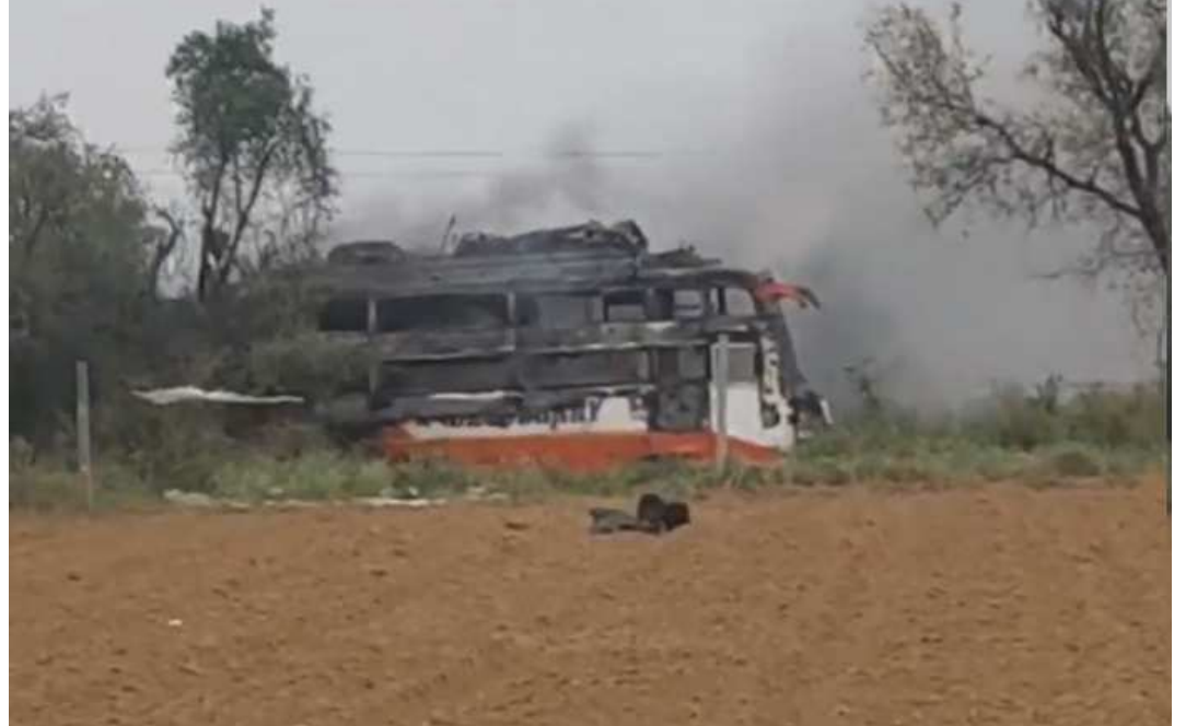
બસમાં ભીષણ આગ ફાટી નીકળી. આ ગંભીર અકસ્માતમાં ૨ મુસાફરોનાં દર્દનાક મોત નીપજ્યાં છે, જ્યારે ૧૦થી વધુ લોકો દાગી ગયા હોવાની માહિતી મળી રહી છે. બસમાં સવાર તમામ લોકો ઈંટના ભક્કા પર મજૂરી કરવા જઈ રહ્યા હતા. હાઈટેન્શન વાયરો સાથે ટકરાયા બાદ આગની લપેટોમાં દાગી ગયેલા આ મજૂરો ગંભીર રીતે ઘાયલ થયા છે. મળતી માહિતી મુજબ, મજૂરોથી ભરેલી આ બસ ઉત્તર પ્રદેશથી મનોહરપુરના ટોડી સ્થિત ઈંટના ભક્કા પર આવી રહી હતી. રસ્તામાં, બસ ઉપરથી પસાર થઈ રહેલી ૧૧ હજાર વોલ્ટના વાયરના સંપર્કમાં આવી, જેના કારણે બસમાં કરંટ ફેલાયો અને સ્પાઈકિંગથી આગ લાગી. ઘટના બાદ સ્થળ પર ચીસાચીસ મચી ગઈ અને અકરાતફરીનો માહોલ સર્જાયો હતો. ઘટનાની જાણ થતાની સાથે જ, મનોહરપુર પોલીસ સ્ટેશનની ટીમ અને વહીવટી અધિકારીઓ તુરંત ઘટના સ્થળે પહોંચી ગયા. તેમણે ઘાયલોને શાહપુરા ઉપજિલ્લા હોસ્પિટલમાં પહોંચાડ્યા. ત્યાં પ્રાથમિક

રાજસ્થાનની રાજધાની જયપુરના મનોહરપુર વિસ્તારમાં એક સ્વીપર બસમાં આગ લાગવાને કારણે અકસ્માત થયો છે. આ દુર્ઘટનાનું કારણ એ હતું કે ચાલતી બસ વીજળીના હાઈટેન્શન વાયરો સાથે ટકરાઈ અને વાયરો સાથેના ટકરાવ બાદ