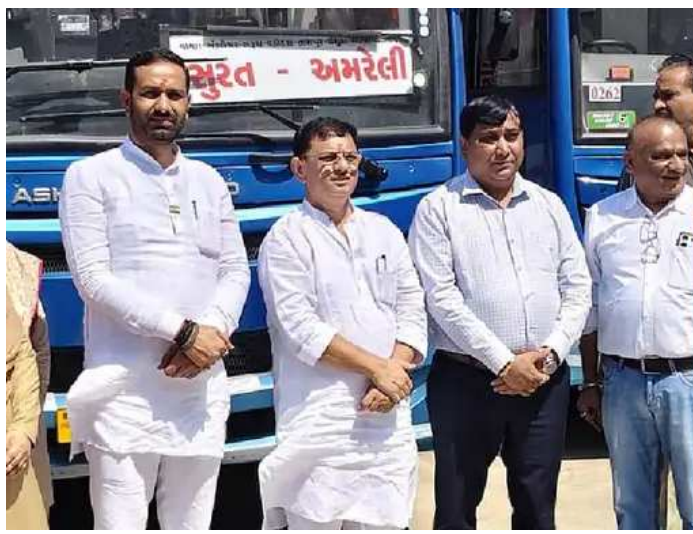
૨૬માંથી દર ચોથો મંત્રી સૌરાષ્ટ્રનો

૨૦૨૨ની ચૂંટણી બાદ ભૂપેન્દ્ર પટેલને ફરીથી મુખ્યમંત્રી બનાવાયા હતા. તેમની સાથે અન્ય ૧૬ મંત્રીને પણ મંત્રીમંડળમાં સ્થાન અપાયું હતું, જેમાં મુખ્યમંત્રી ઉપરાંત કેબિનેટ કક્ષાના ૮ અને રાજ્યકક્ષાના ૮ મંત્રી હતા. પોણાત્રણ વર્ષથી મંત્રીમંડળમાં ફેરફાર કરાયો નથી, એટલે આ વખતે પૂર્ણ કદનું રહેશે. એના કારણે સૌરાષ્ટ્રમાંથી પણ મંત્રીઓની સંખ્યા વધી છે.