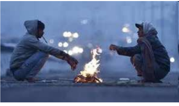
ટકોરા મારી રહ્યો છે. ગત રાત્રિએ ૧૭.૬ ડિગ્રી સાથે અમરેલીમાં સૌથી નીચું તાપમાન નોંધાયું હતું.

ગુજરાતમાં નવરાત્રિ બાદ હવે દિવાળીના તહેવારો વખતે પણ વરસાદ રંગમાં ભંગ પાડી શકે છે. આગામી ૧૬થી ૨૦ ઓક્ટોબર દરમિયાન સૌરાષ્ટ્ર, દક્ષિણ ગુજરાતના કેટલાક જિલ્લામાં હળવા વરસાદની આગાહી હવામાન વિભાગ દ્વારા કરવામાં આવી છે. હવામાન વિભાગની આગાહી અનુસાર, ૧૬મીએ ડાંગ, તાપી, નવસારી વલસાડમાં વરસાદની સંભાવના છે. ૧૭થી ૨૦ દરમિયાન અમરેલી, ભાવનગર, ગીર સોમનાથ, ડાંગ, તાપી, નવસારી, વલસાડમાં હળવોથી મધ્ય વરસાદ પડી શકે છે. આમ, દિવાળીના તહેવારો વખતે પણ વરસાદની સંભાવનાથી લોકોની ચિંતામાં વધારો થયો છે. દરમિયાન ગુજરાતને દ્વારે શિયાળો પણ