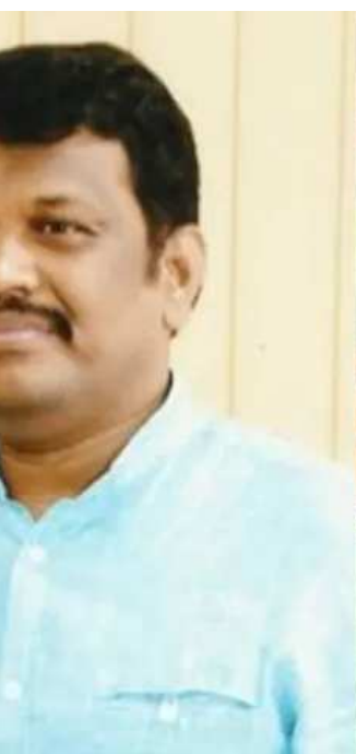
ઉદ્યોગપતિઓને ભારે આપ્યા છે. બેંગલુરુના કેટલાક લોકો બીચ

શેક્સમાં વડાપાઉ પીરસી રહ્યાં છે. તો કેટલાક ઈડલી-સાંભાર વેચી રહ્યાં છે. આ કારણે જ ગોવામાં ઈન્ટરનેશનલ ટુરિઝમમાં ઘટાડો થયો છે. દરિયાકાંઠાના પટ્ટામાં ઉત્તર હોય કે દક્ષિણ વિદેશી પર્યટકોની સંખ્યામાં ભારે ઘટાડો નોંધાયો છે. આ માટે ઘણા પરિબણો જવાબદાર છે પરંતુ, હિસ્સેદાર તરીકે દરેક વ્યક્તિએ જવાબદારી લેવી જોઈએ.