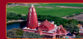
नागेश्वर मंदिर भारतना द्वार ज्योतिर्लिंगमां थी अेक अने गुजरातमां स्थित वे ज्योतिर्लिंग मांथी अेक छे.

सोमनाथ महोत्सव 📅 24 थी 26 फेब्रुआरी, 2025 🕒 सांजे 7.00 वाग्याथी 📍 समुद्रदर्शन पथ पासेनुं मेदान, सोमनाथ मंदिरनी पासे, गीर सोमनाथ