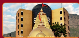
लवनाथ महादेव गिरनारनी तलेटीमां लवनाथ इपे शिवलु निराजे छे.