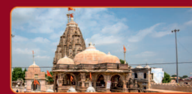
लाटकेश्वर महादेव वडनगरमां स्थित लाटकेश्वर महादेव अेक अत्यंत प्राचीन अने पूजनीय मंदिर छे.