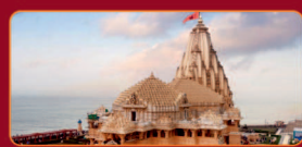
सोमनाथ महादेव भारतना द्वार ज्योतिर्लिंगमां सौप्रथम मानवामां आवे छे.