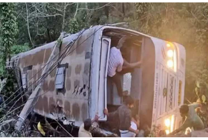
લગભગ ૦૬.૧૫ વાગે થઈ. જાણકારી અનુસાર બસે એક વળાંક પર નિયંત્રણ ગુમાવી દીધું અને ૩૦ ફૂટ ઊંડી ખીણમાં જઈ પડી. દુર્ઘટના બાદ ઘટના સ્થળે રેસ્ક્યુ ઓપરેશન ચલાવવામાં આવ્યું. પોલીસે જણાવ્યું, 'સોમવારે સવારે પહાડી જિલ્લામાં પુલ્લુપારા નજીક એક સરકારી બસ ખીણમાં પડી જવાથી એક મહિલા સહિત

કેરળના ઈડુક્કી જિલ્લાના મુંડકયમમાં KSRTC ની એક બસની સાથે દુર્ઘટના ઘટી. મુસાફરોથી ભરેલી બસ ખીણમાં પડી જવાથી ચાર મુસાફરોના મોત નીપજ્યા અને ઘણા અન્ય ઈજાગ્રસ્ત થઈ ગયા. ઘટનાનો શિકાર થયેલી બસમાં ૩૪ મુસાફર અને ત્રણ કર્મચારી સવાર હતા. તમામ મુસાફર મવેલિક્કારા વિસ્તારના રહેવાસી હતા. KSRTCની બસ તમિલનાડુના તંજાવુરમાં ટૂર લઈને મવેલિક્કારા પરત ફરી રહી હતી. આ દુર્ઘટના આજે એટલે કે સોમવારે સવારે