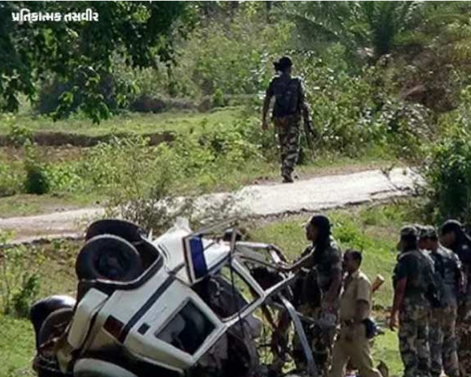
પોલીસ સ્ટેશનના અંબેલી ગામ નજીક નક્સલીઓએ IED બ્લાસ્ટ કરી સુરક્ષા દળનું વાહન ઉડાવી દીધુ હતું. છત્તીસગઢમાં સુરક્ષા દળો અને નક્સલીઓ વચ્ચે છેલ્લા કેટલાક દિવસથી અથડામણ ચાલી રહી છે. ગઈકાલે અબૂઝમાડ ક્ષેત્રમાં સુરક્ષા દળો અને નક્સલવાદીઓ વચ્ચે થયેલી અથડામણમાં ચાર નક્સલવાદીઓ ઠાર થયા હતાં. તેમના શબ જમ કરવામાં આવ્યા હતાં. આ અથડામણમાં સુરક્ષા દળોએ એકે-૪૭ અને એસએલઆર સહિત ઓટોમેટિક હથિયારો પણ જમ કર્યા હતાં.

છત્તીસગઢના બીજાપુરમાં નક્સલવાદીઓએ મોટો હુમલો કર્યો છે. જેમાં આઈઈડી બ્લાસ્ટમાં નવ જવાનો શહીદ થયા છે. જ્યારે અન્ય આઠ ગંભીર રૂપે ઈજાગ્રસ્ત છે. નક્સલવાદીઓએ કુટરૂ માર્ગમાં સુરક્ષા દળના વાહનને ટાર્ગેટ બનાવ્યો હતો. સુરક્ષા દળો નક્સલ પ્રભાવિત વિસ્તારો દંતેવાડા, નારાયણપુર અને બીજાપુરમાં નક્સલીઓ વિરૂદ્ધ ઓપરેશન પતાવી પરત ફરી રહ્યા હતા. બપોરે ૨.૧૫ વાગ્યે કુટરૂ