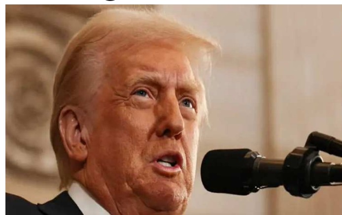
લિંગથી બીજા લિંગમાં કહેવાતા ‘ટ્રાન્ઝીશન’ને ફંડ, સ્પોન્સર, પ્રોત્સાહન, સહાય અથવા મર્યાદિત કરનારા તમામ કાયદાઓને સખતીથી લાગુ કરશે. ‘

અમેરિકામાં ટ્રમ્પ સરકારે વધુ એક મોટો નિર્ણય લીધો છે. અમેરિકામાં હવે લિંગ પરિવર્તન કરવું સરળ નહીં રહેશે. પ્રમુખ ડોનાલ્ડ ટ્રમ્પે લિંગ પરિવર્તન કાયદા પર હસ્તાક્ષર કરી દીધા છે. ટ્રમ્પના આદેશ પ્રમાણે અમેરિકામાં ૧૮ વર્ષથી ઓછી ઉંમરના લોકો લિંગ પરિવર્તન નહીં કરાવી શકશે. પ્રમુખ ડોનાલ્ડ ટ્રમ્પે મંગળવારે તેના પર પ્રતિબંધ મૂકવા માટે એક કાર્યકારી આદેશ પર હસ્તાક્ષર કર્યા છે. ટ્રમ્પે એક નિવેદનમાં કહ્યું કે, ‘અમેરિકાની નીતિ છે કે તે બાળકના એક