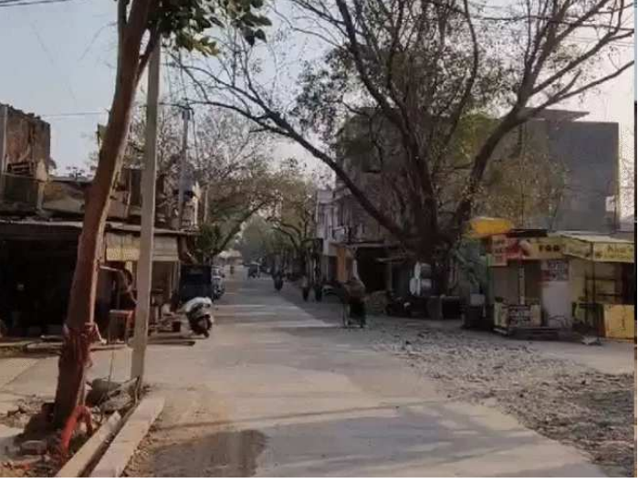
કોલ્ડવેવનું યલો એલર્ટ છે. વેસ્ટર્ન ડિસ્ટર્બન્સ ૨૯ જાન્યુઆરીએ ફરી એક્ટિવ થવાની ધારણા છે. તેથી બાદમાં ફરી હિમવર્ષા થઈ શકે છે. શનિવારે દિલ્હીમાં આકાશ સ્વચ્છ રહેશે, ભારે પવન ફૂંકાઈ

હવામાન વિભાગે શનિવારે ૧૧ રાજ્યોમાં ધુમ્મસનું એલર્ટ જાહેર કર્યું છે. જમ્મુ-કાશ્મીરમાં હિમવર્ષામાં ઘટાડો થયો છે. હિમાચલ પ્રદેશમાં હિમવર્ષા અને વરસાદ બંધ થઈ ગયો છે. પરંતુ ઠંડી અકબંધ છે. જમ્મુ અને કાશ્મીરમાં, આગામી ૫ દિવસમાં દિવસનું તાપમાન વધવાની અને રાત્રિના તાપમાનમાં ૧-૩ ડિગ્રી સેલ્સિયસનો ઘટાડો થવાની ધારણા છે. હિમાચલમાં આગામી ૪ દિવસ સુધી હિમવર્ષા કે વરસાદની કોઈ શક્યતા નથી. ૫ જિલ્લામાં