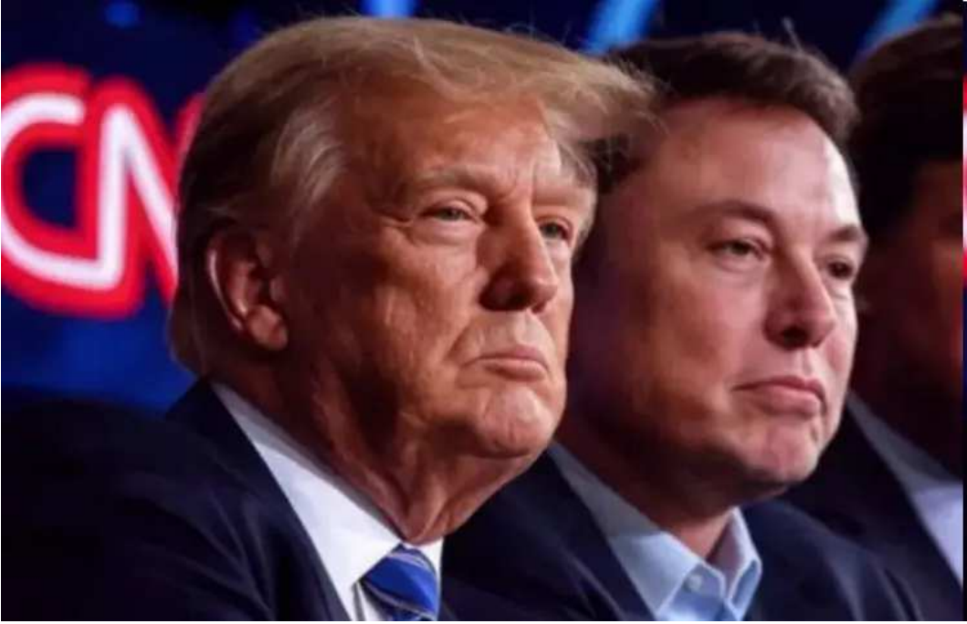
વિશ્વના સૌથી અમીર રાષ્ટ્રપતિ ડોનાલ્ડ ટ્રમ્પ વચ્ચેની સાંભળવા મળી રહી છે. પરંતુ બિઝનેસમેન ઈલોન મસ્ક અને મિત્રતાની વાતો છેલ્લા કેટલાક અઢી મહિનાઓથી શકિતશાળી દિવસોથી દુનિયાના ખૂણે-ખૂણે અચાનક એક પ્રોજેક્ટની જાહેરાત સાથે બંને વચ્ચે અણબનાવ