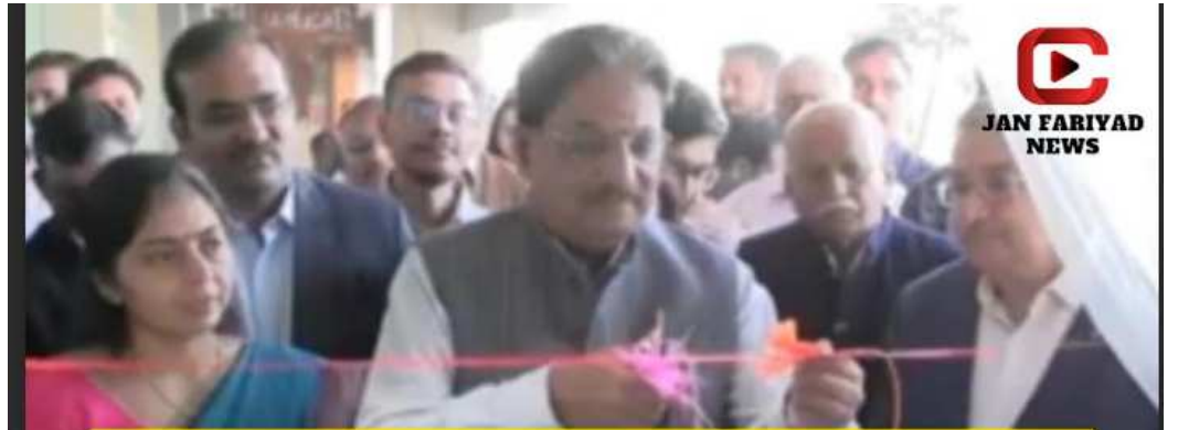
રાયસણ ખાતે ઓર્થોપેડિક, ડેન્ટલ હોસ્પિટલ શુભારંભ