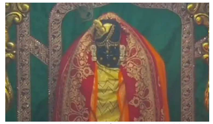
વાગ્યે ઉત્થાપન અને ત્યારબાદનો કાર્યક્રમ રાખેતા મુજબનો રહેશે. જ્યારે જાન્યુઆરી ૨૦૨૫માં પણ ભગવાનના દર્શનના સમયમાં ફેરફાર કરવામાં આવ્યો છે.

ગુજરાત પ્રસિદ્ધ યાત્રાધામ ડાકોર અને દ્વારકા ખાતે દર્શનાર્થે આવતા શ્રદ્ધાળુઓની ભીડ જોવા મળતી હોય છે, ત્યારે ધનુમસિનો પ્રારંભ થતા ડાકોર અને દ્વારકામાં ભગવાનના દર્શન કરવાના સમયમાં ફેરફાર કરવામાં આવ્યો છે. સવારે ૦૬:૧૫ વાગ્યે મંગળા આરતીના દર્શન ધનુમસિનો પ્રારંભ થતા ડાકોરમાં ભગવાન રણછોડરાયજીના દર્શનના સમયમાં ફેરફાર કરવામાં આવ્યો છે. સવારે ૦૬:૪૫ વાગ્યે થતી મંગળા આરતીના સમયમાં ફેરફાર કરાયો છે. જેમાં હવે શ્રદ્ધાળુઓ સવારે ૦૬:૧૫ વાગ્યે મંગળા આરતીના દર્શન કરી શકશે. ધનુમાસ દરમિયાન રણછોડરાયજીને વિશેષ ખીચડીનો ભોગ ધરાવવામાં આવે છે. દ્વારકાધીશના દર્શનના સમયમાં ફેરફાર પ્રસિદ્ધ દ્વારકાધીશ જગતમંદિર ખાતે ધનુમસિના ઉત્સવોમાં ભગવાનના દર્શનના સમયમાં ફેરફાર કરાયો હોવાથી ૧૯-૨૪ ડિસેમ્બર એટલે કે મંગળવાર અને ગુરુવારે સવારે ૦૫:૩૦ વાગ્યે મંગળા આરતી, ૧૦:૩૦ વાગ્યે અનોસર, સાંજે ૦૫:૦૦