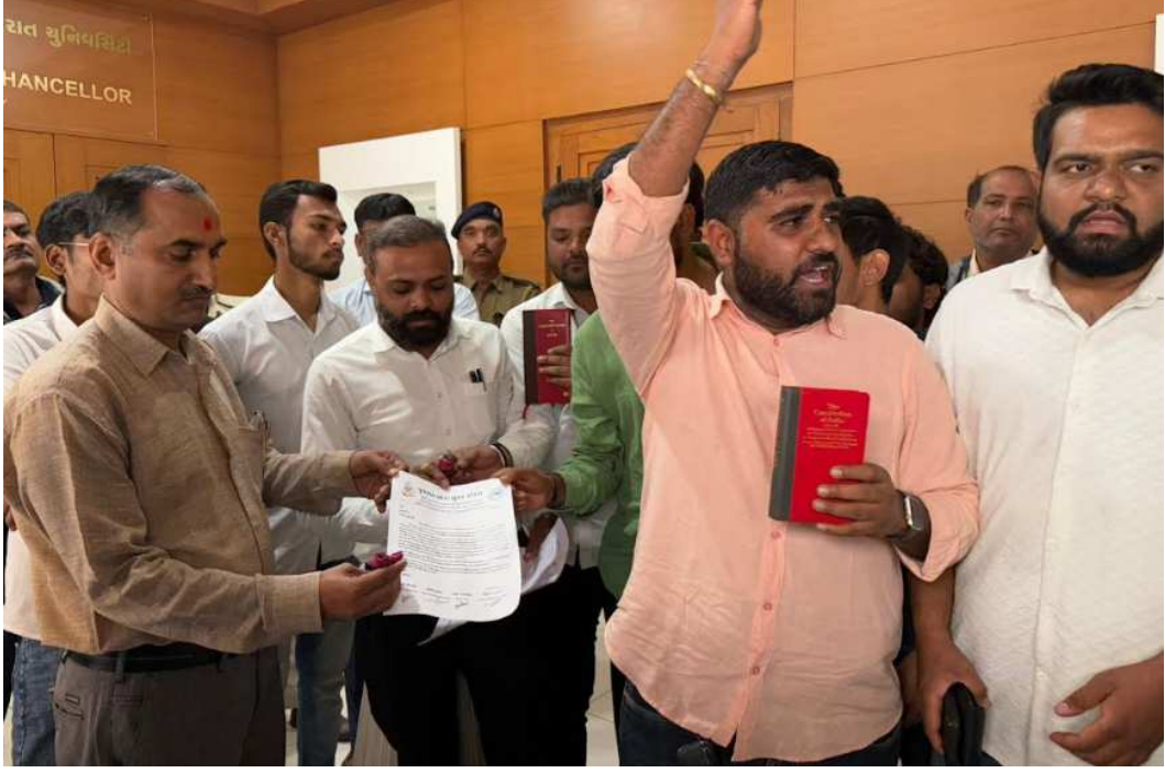
યુથ કોંગ્રેસના મહામંત્રી ચાંદીમાં જણાવે છે કે ગુજરાત વારંવાર ડો. બાબાસાહેબ ગોરાંગ મકવાણા એક અપમાન યુનિવર્સિટી ના કુલપતિ શ્રી દ્વારા આંબેડકરનું અપમાન કરવામાં

આવી રહ્યું છે. વિશ્વવિભૂતિ ડો. બાબાસાહેબ આંબેડકરની જન્મજયંતિ ૧૪ ડિસેમ્બર પર કોઈ પણ ઉજવણી ન કરવામાં આવી તેમજ ૨૬ નવેમ્બર બંધારણ દિવસ વખતે કે ૬ ડિસેમ્બર પર કોઈ પણ કાર્યક્રમના કરી અને સોશિયલ મીડિયા માં પણ પોસ્ટ મૂકવામાં આવતી નથી જે બાબા સાહેબ આંબેડકરનું અપમાન અને વિરોધી માનસિકતા છતી કરેલ છે. જે વ્યક્તિ નો લેજ ઓફ સિમ્બોલ અને કાયદાવિદ તેમજ શિક્ષણવિદ તરીકે ઓળખવામાં આવે છે તેમની અવગણના યુનિવર્સિટી ના સત્તાધીશો દ્વારા કરી સમગ્ર વિદ્યાર્થીઓનું પણ અપમાન કરેલ છે. યુનિવર્સિટી ના કુલપતિ તેમજ રજિસ્ટ્રારને આ રજૂઆત કરવા