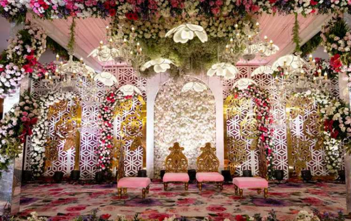
વેડિંગ પ્લાનર્સ પર નજર રાખવામાં આવી રહી છે. સુત્રોએ જણાવ્યું હતું કે ટૂંક સમયમાં વિદેશમાં યોજાયેલા લગ્નોમાં ખર્ચવામાં આવેલા નાણાંની પણ તપાસ કરવામાં આવશે. આ લગ્નોમાં મહેમાનો અને સ્ટાર્સને ચાર્ટર્ડ પ્લેનમાં વિદેશ લઈ જવામાં આવે છે. ટેક્સ વિભાગ સત્તાવાર રીતે મહેમાનોની સંખ્યા અને ઈવેન્ટની શૈલી સાથે ખર્ચવામાં આવેલી રકમની તુલના કરશે. આ

હતાં. ઈનકમ ટેક્સ ડિપાર્ટમેન્ટની માહિતી અનુસાર, છેલ્લા એક વર્ષમાં દેશમાં લગ્નના આયોજન પાછળ ૭૫૦૦ કરોડ રૂપિયાનો ખર્ચ કરવામાં આવ્યો હતો, જેનો કોઈ હિસાબ નથી. વાસ્તવમાં દેશના અમીર લોકો ભવ્ય લગ્નો કરે છે. જેનો ફાયદો કોભાંડીઓ અને કરચોરી કરનારાઓ પણ ઉઠાવીને પોતાના કાળા નાણાંને સફેદ કરી રહ્યા છે. લગ્નો પર ખર્ચ કરવામાં આવતાં ૫૦ થી ૬૦ ટકા ખર્ચ વેડિંગ પ્લાનર્સ દ્વારા થતાં હોવાની જાણ થતાં આઈટી દરોડામાં મુખ્યત્વે