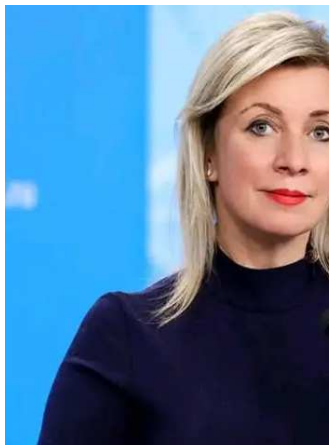
મારિયા જબારોવાએ બુધવારે એક સમાચાર બ્રીફિંગના માધ્યમથી ચેતવણી જારી કરી છે. -અમેરિકા સંબંધ અત્યાર સુધીના સૌથી

વિશ્વના ઘણા દેશો અત્યારે મોટા સંકટથી પસાર થઈ રહ્યાં છે. તેમાં એક રશિયા પણ છે જે યુક્રેનની સાથે યુદ્ધમાં છે. યુક્રેનને અમેરિકા સતત મદદ કરી રહ્યું છે. રશિયાએ પોતાના નાગરિકોને ચેતવણી આપી છે કે તે અમેરિકાનો પ્રવાસ ન કરે કેમ કે વોશિંગ્ટનની સાથે સંબંધ ટકરાવપૂર્ણ છે. રશિયાએ દાવો કર્યો કે તેમને અમેરિકા અધિકારીઓથી જોખમ થઈ શકે છે. વિદેશ મંત્રાલયની પ્રવક્તા