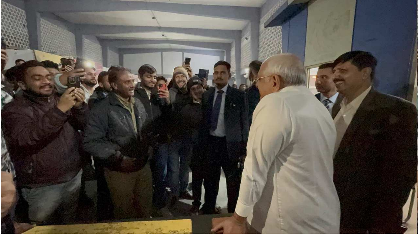
મુખ્યમંત્રીશ્રીએ બસ મથકની સ્વચ્છતા-સફાઈનું નિરીક્ષણ કર્યું હતું. તેમજ કંટ્રોલ રૂમ અને ટીકિટ વિન્ડોની કામગીરી ઝીણવટ પૂર્વક નિહાળી અને બસ મથકમાં મુસાફરો સાથે વાતચીત કરીને તેમને મળતી સુવિધાઓની વિગતો પણ મેળવી હતી. મુખ્યમંત્રી શ્રી ભૂપેન્દ્ર પટેલ કોઈપણ પૂર્વ નિર્ધારિત કાર્યક્રમ વિના અચાનક જ ગાંધીનગરના મુખ્ય બસ મથકે અધિક મુખ્ય સચિવ શ્રી એમ.કે. દાસ સાથે પહોંચ્યા હતા અને મુસાફરો, સામાન્ય નાગરિકો તથા એસ.ટી. બસ મથકમાં ફરજ પરના કર્મચોીઓ સાથે સંવાદ કરીને જાણકારી મેળવી હતી. મુખ્યમંત્રીશ્રીએ સરકારી કચેરીઓ, બસ મથકો વગેરેમાં રાજ્યના નાગરિકોને મળતી સેવા-સુવિધાઓની નિયમિતતા અને ગુણવત્તા ચકાસવા માટે અવાર-નવાર ઓચિંતી મૂલાકાતનો આ ઉપક્રમ અપનાવ્યો છે.