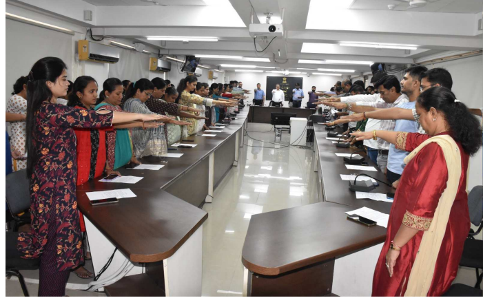
વડાપ્રધાનશ્રી નરેન્દ્રભાઈ મોદીએ ગુજરાત રાજ્યમાં મુખ્યમંત્રી તરીકે પદભાર સંભાળી ૨૩ વર્ષ અગાઉ રાજ્યની વણથંભી વિકાસયાત્રા શરૂ કરી હતી. આ અવસરને વધાવવા માટે રાજ્ય સરકાર દ્વારા સમગ્ર રાજ્યમાં ઓક્ટોબર-૨૦૨૪ની તા.૦૭ થી તા. ૧૫ દરમિયાન 'વિકાસ સપ્તાહ'ની ઉજવણી કરવામાં આવી રહી છે. આ ઉજવણીના ભાગરુપે ગાંધીનગર જિલ્લા કલેક્ટર કચેરી ખાતેથી ગાંધીનગર કલેક્ટરશ્રી મેહુલ દેવેના અધ્યક્ષસ્થાને ભારત વિકાસ પ્રતિજ્ઞા લેવામાં આવી હતી. કલેક્ટર કચેરી ખાતે ફરજ બજાવતા અધિકારીશ્રીઓ તથા જિલ્લા કચેરીઓના કર્મચોગીએ ભારત વિકાસ પ્રતિજ્ઞા લઈને વિકસિત ભારત બનાવવામાં પોતાનું યોગદાન આપવા નિશ્ચય કર્યો હતો.

વિકાસ સપ્તાહની ઉજવણી અંતર્ગત ભારત વિકાસ પ્રતિજ્ઞા ઓનલાઈન લઈ શકાય તે હેતુથી રાજ્ય/કેન્દ્ર/સ્ટેટ/લોકલ/ગ્રામીણ/પોર્ટલ શરૂ કરવામાં આવ્યું છે. જેમાં જોડાઈ ગાંધીનગરના નાગરિકો પ્રતિજ્ઞા લઈને સર્વિફિકેટ મેળવવા અનુરોધ પણ કરવામાં આવ્યો છે.