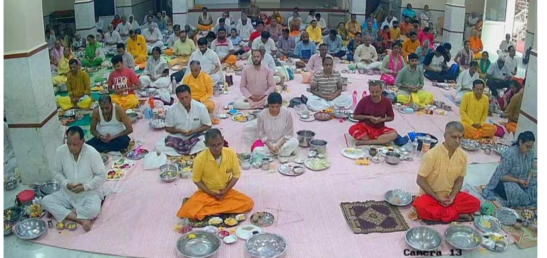
તા. ૨-૧૦-૨૦૨૪ બુધવાર સવારે સર્વ પિતૃ અમાસ નિમિત્તે શ્રાધ્ધ તર્પણ વિધિ અંતર્ગત કાર્યક્રમનું આયોજન ગાયત્રી શક્તિ પીઠ, શાહીબાગ, અમદાવાદ દ્વારા કરવામાં આવ્યું હતું જેનો લાભ શ્રદ્ધાળુઓએ લીધો હતો અને સૌને સદ્ બુધ્ધિ ઉજ્જવળ ભવિષ્ય નિરામય જીવન પ્રાપ્ત થાય તેવી પ્રાર્થના કરવામાં આવી હતી.