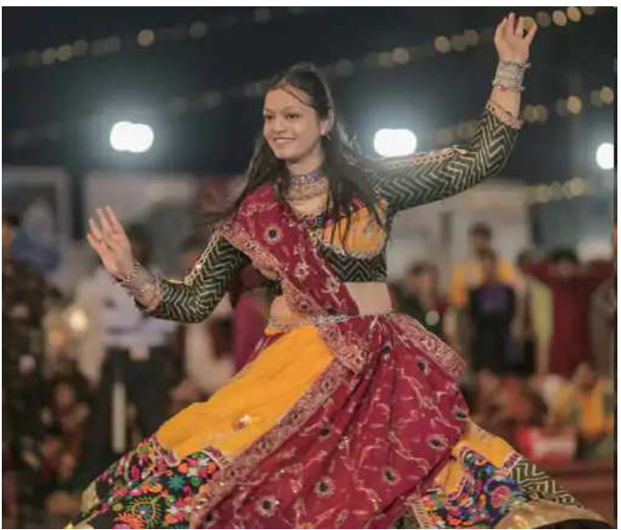
બરાબરનો જામ્યો છે. જેમ જેમ નવરાત્રિના દિવસો જતા જાય છે, તેમ તેમ ખેલૈયાઓ ગરબા ખેલવાનો રંગ જમાવતા જાય છે. ત્યારે રવિવારે રાત્રે પાટણ શહેરના ત્રણ પાર્ટી પ્લોટ માં આયોજિત ગરબા ગ્રાઉન્ડ ખેલૈયાથી ઉભરાઈ ગયા હતા. પરંપરાગત આભૂષણોએ લોકોની આંખો આંજી દીધી હતી. શહેરના મોટા ગરબા આયોજનમાં અવનવા ટ્રેડિશનલ ડ્રેસ પહેરીને