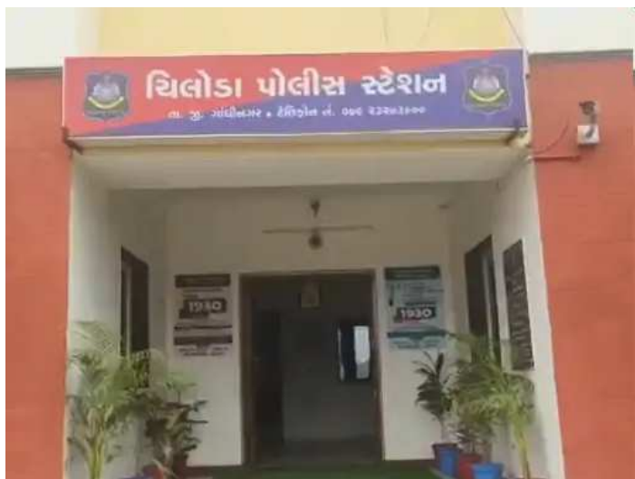
ગાંધીનગરમાં નવરાત્રિને લઈને પોલીસનાં સઘન પેટ્રોલીંગ વચ્ચે મોટી શીહોલી ગામના ફાર્મ

લાખ ૭૬ હજારની ઘરફોડ ચોરીને અંજામ આપવામાં આવતા ચીલોડા પોલીસ મથકે ગુનો નોંધવામાં આવ્યો છે.