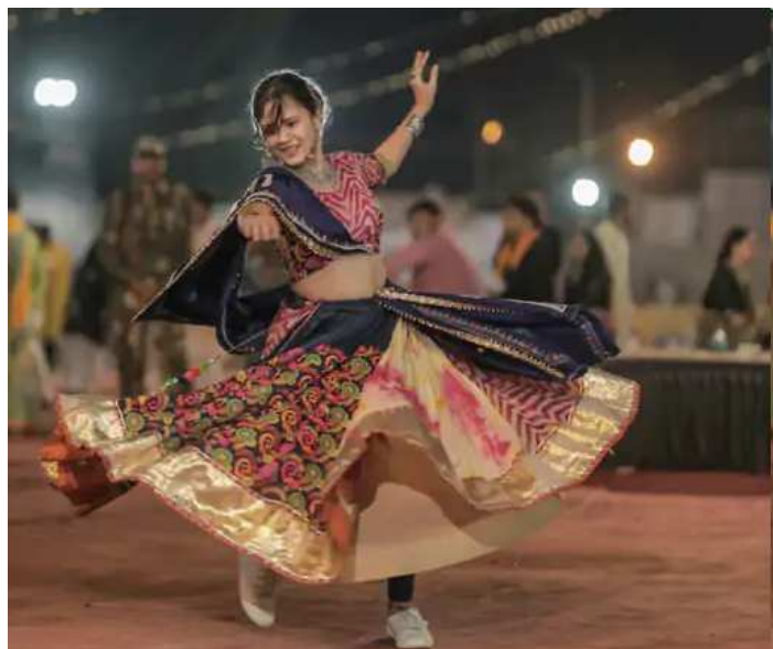
પાટણ શહેરોમાં ખેલૈયાઓએ મન મૂકીને સંગીતના સથવારે પગને તાલ આપ્યો હતો અને ગરબા રમતા રમતા માતાજીની આરાધનામાં ડૂબી ગયા હતા. આમ નોરતાનો માહોલ