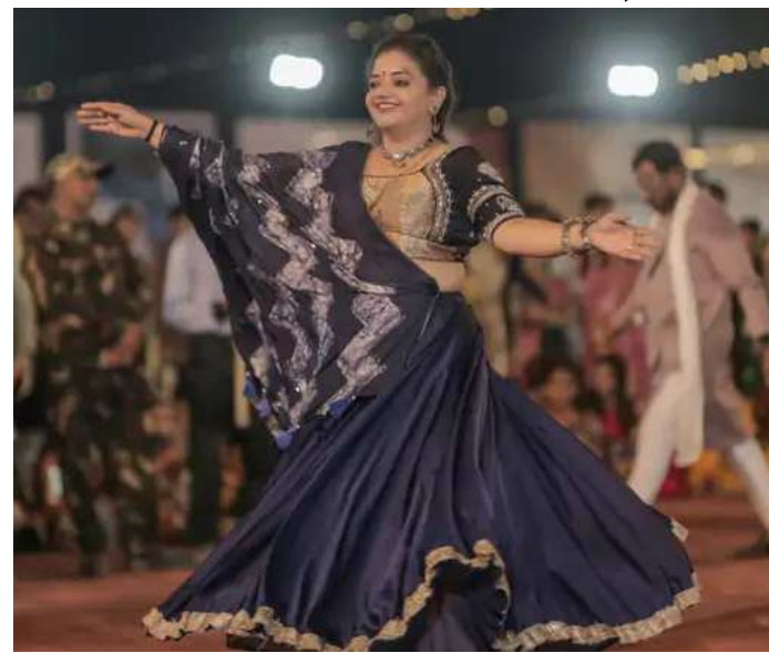
દેવદર્શન સોસાયટી માં સોસાયટી ના રહીશો ગરબે ધૂમ્યા હતા પાટણ શહેર ની આયુષ ટાઉન શિપ માં પણ સોસાયટી ના બાળકો ,યુવાનો મહિલાઓ માતાની ના ગરબા રમ્યા હતા. શિવ બગલોડ

બાળકો પણ માતાજી ગરબા નાચવા જોડ્યા હતા બે તાલી ગરબા બહેનો નાચતી નજરે પડી હતી માતાજી નવલા નોરતાની ગ્રામ્ય પ્રાચીન સસ્કૃતી દર્શન થાય તે રીતે ગરબે રમતા હતા