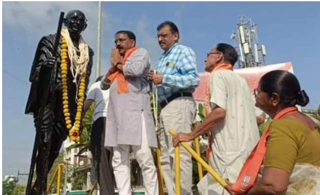
સત્ય, અહિંસા અને સ્વચ્છતાના પુજારી એવા ભારતના રાષ્ટ્રપિતા મહાત્મા ગાંધીજીની જન્મજયંતિની પાટણ શહેરમાં વિવિધ રાજકીય પાર્ટીઓ તેમજ સામાજિક સેવાભાવી સંસ્થાઓ દ્વારા બાપુની પ્રતિમા પર સુતરની આંટી તથા ફુલહાર ચઢાવી પુષ્પાંજલિ અર્પણ કરવાના

કાર્યક્રમો યોજાયા હતા. જે અંતર્ગત પાટણમાં સરકારી તંત્ર, વિવિધ રાજકીય પક્ષો અને સેવાભાવી સંસ્થાઓ દ્વારા ગાંધીજીની પ્રતિમાને માલ્યાર્પણ કરી ગાંધીજી તુમ અમર રહો...ના નારા લગાવવામાં આવ્યા હતા..