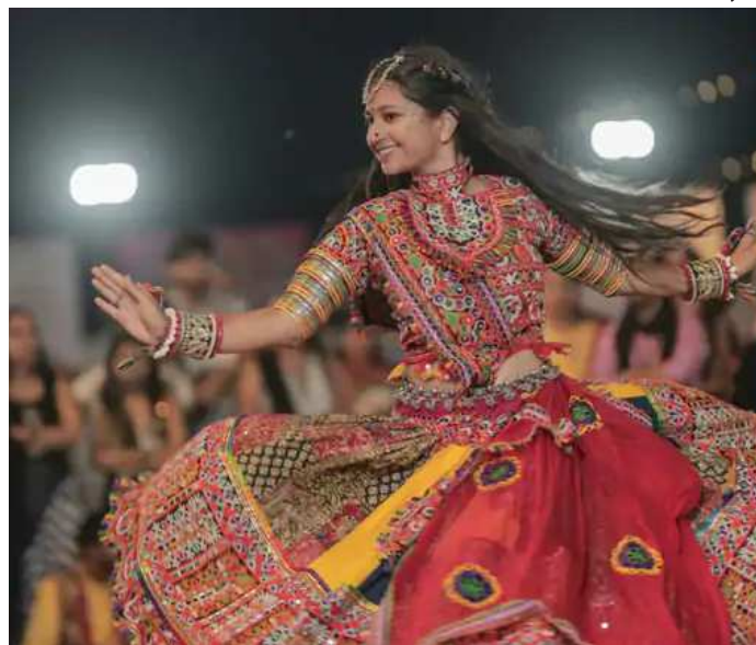
ગરબે રમતા ખેલૈયાઓએ જમાવટ કરી છે. નવરાત્રિના પર્વના ચોથા નોરતે પાટણ શહેરના જુદાં જુદાં ગરબા ગ્રાઉન્ડ પર ખેલૈયાઓની ભારે ભીડ ઊભરી પડી હતી. રંગબેરંગી કેડિયાં-ધોતિયાં અને ચણિયાઓની પહેરીને આવેલાં યુવક-યુવતીઓ મન ભરીને ગરબે ધૂમ્યાં હતાં. દરેક ગરબા મહોત્સવમાં અદભુત દર્શ્યો સર્જ્યાં હતાં. પાટણ શહેર ની