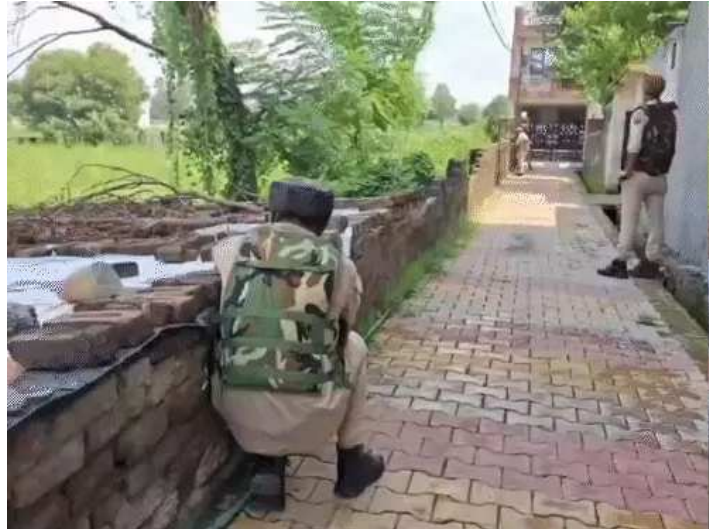
જમ્મુ-કાશ્મીરના સુંજવાન મિલિટરી સ્ટેશન પર સોમવારે સવારે આતંકીઓએ સેના પર ગોળીબાર કર્યો હતો. જેમાં એક જવાન શહીદ થયો છે. સૈન્ય અધિકારીઓએ

જણાવ્યું હતું કે લશ્કરી સ્ટેશનની બહાર છૂપાયેલા આતંકવાદીઓએ સ્નાઈપર ગનથી ગોળીબાર કર્યો હતો. સૈનિક ઘાયલ થયા બાદ તેને હોસ્પિટલમાં લઈ જવામાં