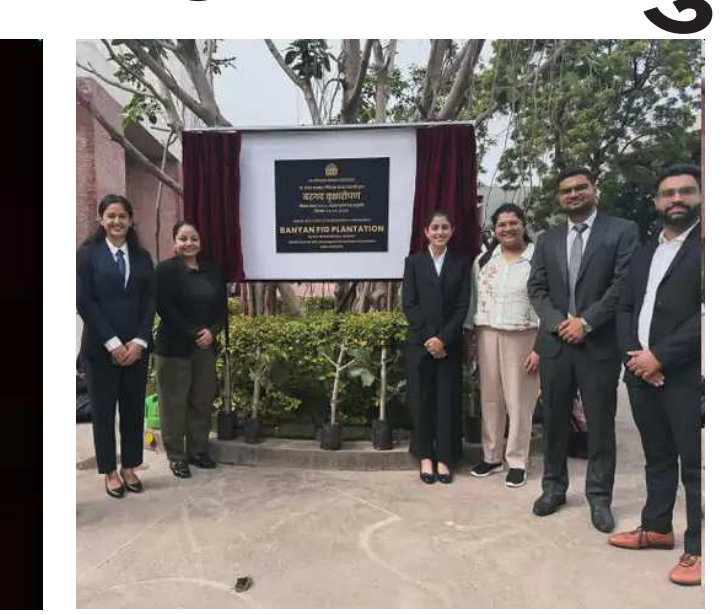
અને ભવિષ્ય માટે આશીર્વાદ આપ્યા છે. તમને જણાવી દઈએ કે, નવ્યા નવેલી નંદા સોશિયલ મીડિયા પર ઘણી એક્ટિવ રહે છે. જ્યારે યુટ્યૂબ પર તેનો એક શો

બેબી. શનાયા કપૂરે કોમેન્ટમાં ઘણા હાર્ટ ઈમોજી શેર કર્યા છે. જ્યારે અનન્યા પાંડે, સોનાલી બેન્દ્રે, જોયા અખ્તર, ભાવના પાંડે અને સુહાના પાને તેને અભિનંદન