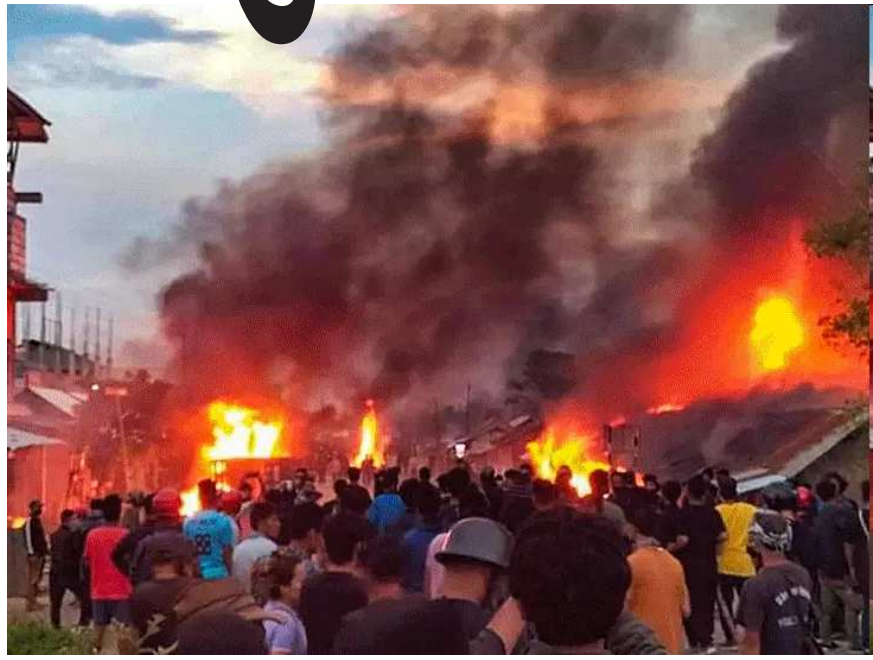
મણિપુરના ઈશ્કાલ પશ્ચિમ જિલ્લામાં રવિવારે આતંકવાદીઓ દ્વારા કરવામાં આવેલા હુમલામાં એક મહિલા સહિત બે લોકોનાં

મોત થયા હતા. મહિલાની ૮ વર્ષની પુત્રી અને એક પોલીસ અધિકારી સહિત નવ લોકો ઘાયલ થયા હતા. પોલીસના જણાવ્યા