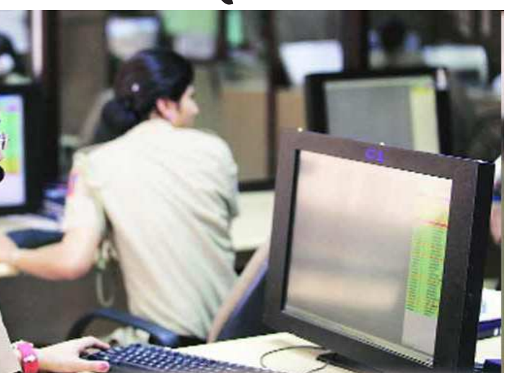
જ નથી અને સવારથી ક્યાંક ચાલ્યા ગયા છે તેમ કહી મદદ માંગી હતી. પોલીસ કંટ્રોલના કર્મચારીએ પતિનો ફોનથી વારંવાર સંપર્ક કરતાં થોડીવાર બાદ ફોન લીધો હતો.

શહેર પોલીસ ભવનમાં દોડી આવેલી એક મહિલાએ તેના પતિની વિચિત્ર હરકત અંગે મદદ માંગતા પોલીસ કંટ્રોલરૂમે ભરૂચ પોલીસ સાથે સંકલન કરીને તેનો પરિવાર સાથે મેળાપ કરવો હતો. વડોદરા પોલીસ કંટ્રોલરૂમમાં તાજેતરમાં બનેલો બનાવ પોલીસમાં ચર્ચામાં રહ્યો હતો. જેમાં પોલીસ કંટ્રોલરૂમમાં મદદ માટે દોડી આવેલી એક મહિલાએ તેના પતિને વળગાડ જેવું કાંઈ થઈ ગયું છે અને સતત સ્કૂટર દોડાવ્યા કરે છે... રોકાતા