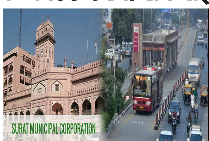
માસ્ટર પ્લાન બનાવ્યા બાદ ૨૦૨૦માં સુરતનું ફરીથી મોટું હદ વિસ્તરણ થયું અને તેમાં મોટો વિસ્તાર અને વસ્તીનો સમાવેશ સુરત પાલિકામાં થયો છે.

સુરત મહાનગરપાલિકાએ પરિવહનની સરળતા અને તેને સંલગ્ન ઈન્ફ્રાસ્ટ્રક્ચર રેવલપમેન્ટ અને કેન્દ્રમાં રાખીને ૨૦૦૬માં પ્રથમ વખત કોમ્પ્રિહેન્સિવ પ્લાન બનાવ્યો હતો. ત્યારબાદ ૨૦૧૬ માં ફરીથી કોમ્પ્રિહેન્સિવ પ્લાન અપડેટ કર્યો હતો. જોકે, ત્યારબાદ પાલિકાનું હદ વિસ્તરણ બાદ શહેરની વસ્તી અને વિસ્તારમાં વધારો થતાં માત્ર આઠ જ વર્ષના ગાળામાં કોમ્પ્રિહેન્સિવ મોબિલિટી પ્લાનમાં સુધારો કરવા માટે આયોજન થઈ રહ્યું છે. જેના ભાગરૂપે ઓગસ્ટથી ઓક્ટોબર માસ સુધીનો સર્વે કરવામાં આવશે અને ત્યારબાદ પ્લાન અપડેટ કરાશે. સુરત મહાનગરપાલિકાના હદ વિસ્તારમાં છેલ્લા એક દાયકામાં વસ્તી, વાહનોની સંખ્યામાં ધરમધ વધારો થવાની સાથે જ કોમ્પ્રિહેન્સિવ મોબિલિટી પ્લાન ૨૦૧૬ બાદ ફરીથી સુધારો કરવાની જરૂરિયાત ઊભી થઈ છે. સુરત મહાનગરપાલિકાના ૨૦૨૪-૨૫ના બજેટમાં સુરતમાં પરિવહન, વસ્તી, ટ્રાફિકની પ્રવર્તમાન સ્થિતિને જોતાં કોમ્પ્રિહેન્સિવ મોબિલિટી પ્લાનને અપડેટ કરવા રૂ. ૧.૩૦ કરોડની જોગવાઈ કરી હતી. સુરત પાલિકા વિસ્તારમાં પાલિકાએ સામુહિક પરિવહન સેવાના ભાગરૂપે