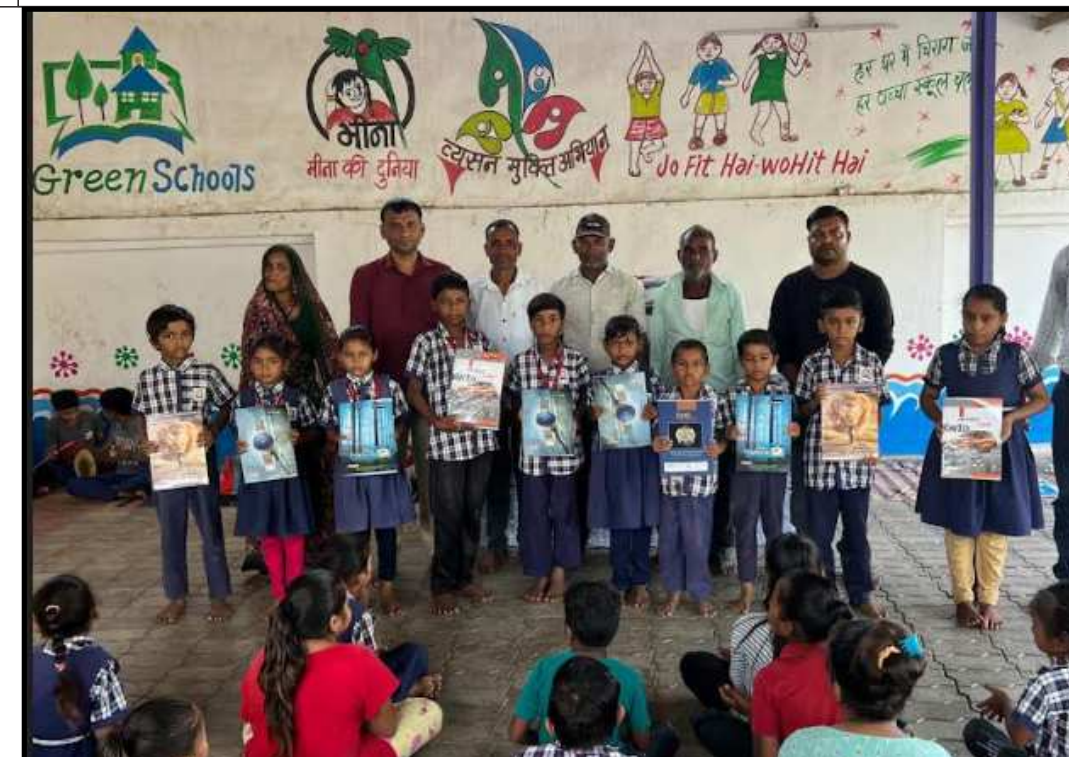
આજરોજ અહમદપુર પ્રાથમિક શાળામાં અભ્યાસ કરતા બાલવાટિકાથી ધોરણ ૮ સુધીના ૨૪૦ વિદ્યાર્થીઓને દાતાઓના સહયોગથી સતત સાતમા વર્ષે શૈક્ષણિક સાહિત્ય વિના મૂલ્યે આપવામાં આવ્યું. વિદ્યાર્થીઓને જરૂરિયાત ભુજબ ચોપડા, નોટબુક, પેન અને પેન્સિલ જેવી તમામ સામગ્રી એક સાથે મળી જતાં વિદ્યાર્થીઓના ચહેરા પર સ્મિત જોવા મળ્યું.