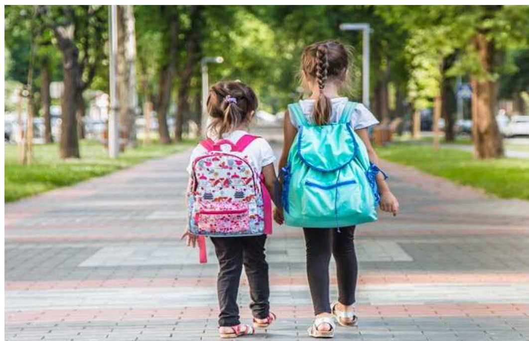
કિ.મી.ના અંતરનું ભાડું ૧૦૦૦ રૂપિયા વાલીઓ પાસેથી વસૂલવામાં આવતું હતું. જે હવે વધારા બાદ ૧૨૦૦ રૂપિયા ચૂકવવા પડશે. આ ઉપરાંત પાંચ કિ.મી.ના રૂપિયા ૧૮૦૦થી વધારી ૨૦૦૦ રૂપિયા કરવામાં આવ્યા છે. જ્યારે રિક્ષામાં એક કિ.મી.ના અંતરનું ભાડું ૬૫૦ રૂપિયા વસૂલવામાં આવતું હતું. જે હવે ૭૫૦ રૂપિયા ચૂકવવા પડશે. બે કિ.મી.ના રૂપિયા ૭૫૦થી વધારી ૮૫૦ રૂપિયા કરવામાં આવ્યા છે. પાંચ કિ.મી.નું ભાડું રૂ. ૧૦૫૦થી વધારી ૧૧૫૦ રૂપિયા કરવામાં આવ્યું છે. આ નવો ભાવ આગામી શૈક્ષણિક સત્રથી લાગુ કરવામાં આવશે. ઉદલેખનીય છે કે, રાજકોટ અગ્નિકાંડ બાદ આરટીઓ દ્વારા સ્કૂલવર્ધીના વાહનોની ફિટનેસની કામગીરીમાં નિયમોનું કડક પાલન કરાવવામાં આવી રહ્યું છે. જેમાં ઈં રજિસ્ટ્રેશન, ફિટનેસ પાસિંગમાં રૂપિયા ૫૦ હજાર સુધીનો જેટલો ખર્ચ થઈ રહ્યો છે, જેથી અમદાવાદ સ્કૂલ વર્ધી એસોસિયેશન દ્વારા સ્કૂલ વાન અને રિક્ષાના ભાડામાં વધારો કરવામાં નિર્ણય લીધો છે.

રાજ્યમાં શૈક્ષણિક સત્ર શરૂ થતા પહેલા જ અમદાવાદ સ્કૂલ વર્ધી એસોસિયેશને સ્કૂલ વાન અને રિક્ષાના ભાડામાં વધારો કર્યો છે. આરટીઓમાં પાસિંગ ખર્ચનો બોજ, ઈન્સ્યોરન્સ અને પરમિટના ખર્ચને ધ્યાનમાં રાખીને સ્કૂલ વાન અને રિક્ષાના ભાડામાં ૨૦ ટકાનો વધારો કર્યો છે. નોંધનીય છે શાળાઓમાં નવુ શૈક્ષણિક સત્ર ૧૩મી જૂનથી જ શરૂ થઈ જશે.