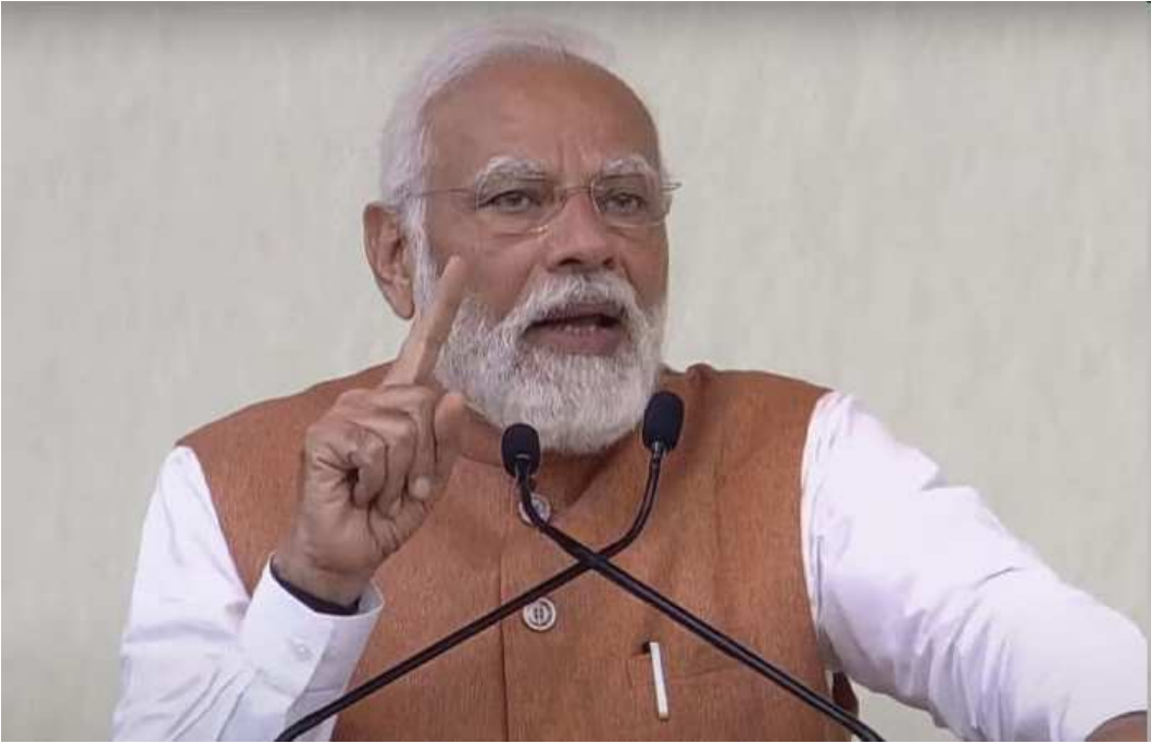
સુપ્રીમ કોર્ટે આજે ચૂંટણી મોદી અને ભાજપના (hate speech)ના ભાષણો દરમિયાન વડાપ્રધાન નરેન્દ્ર નેતાઓના કથિત નફરત ભર્યા વિરુદ્ધ દાખલ કરવામાં આવેલી

અરજીઓને ફગાવી દીધી હતી. પૂર્વ અમલદાર ઈછ્છ શાહ અને ફાતિમા નામના અરજદારે તેમની અરજીમાં ચૂંટણી પંચને વડાપ્રધાન મોદી વિરુદ્ધ કાર્યવાહી કરવા માટે નિર્દેશ આપવાની માંગ કરી હતી. ૨૧ એપ્રિલે રાજસ્થાન (ઈકે ડક ડક ૨૬૬) ના ભાંસવાડામાં વડાપ્રધાન દ્વારા આપવામાં આવેલા ચૂંટણી ભાષણ સામે વાંધો ઉઠાવવામાં આવ્યો હતો. સુપ્રીમ કોર્ટમાં સુનાવણી દરમિયાન જસ્ટિસ વિક્રમ નાથ અને સતીશ ચંદ્ર શર્માની બેન્ચે અરજદારોના વકીલને કહ્યું કે 'આ એવો વિષય નથી કે જેના માટે સીધી સુપ્રીમ કોર્ટમાં અરજી દાખલ