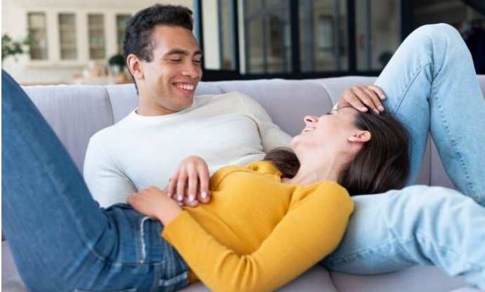
બેન્ચે લિવ ઈન રિલેશનશીપમાંથી જન્મેલા બાળકની કસ્ટડીના મામલામાં કડક ટિપ્પણી કરી હતી. પિતાએ બાળકની કસ્ટડીને લઈને હાઈકોર્ટમાં અરજી કરી હતી. આ જ કેસની સુનાવણી બાદ કોર્ટે આ અરજી ફગાવી દીધી હતી. આકરી ટીપ્પણી કરતાં કોર્ટે કહ્યું હતું કે, સમાજના કેટલાક વર્ગોમાં અપનાવવામાં આવેલ લિવ ઈન રિલેશનશીપ હજુ પણ ભારતીય સંસ્કૃતિમાં કલંક સમાન છે, કારણ કે લિવ ઈન રિલેશનશીપ એક આધ્યાત્મિક પ્યાલ છે. તે ભારતીય રિવાજોની સામાન્ય અપેક્ષાઓથી વિરુદ્ધ છે. કોર્ટે કહ્યું કે, વિવાહિત વ્યક્તિ માટે લિવ ઈન રિલેશનશીપમાંથી બહાર આવવું ખૂબ જ સરળ છે. આવા કિસ્સાઓમાં, કોર્ટે આ ત્રાસદાયક લિવ ઈન રિલેશનશીપમાંથી બચી ગયેલી વ્યક્તિ અને તે સંબંધમાંથી જન્મેલા બાળકોની દુર્દશા પ્રત્યે આંખો બંધ કરી શકતી નથી.

છત્તીસગઢ હાઈકોર્ટે લિવ ઈન રિલેશનશીપને લઈને મહત્વનો નિર્ણય સંભળાવતા કોર્ટે લિવ ઈન રિલેશનશીપને 'ફલંક' ગણાવ્યું છે. કોર્ટે કહ્યું છે કે આ ભારતીય સંસ્કૃતિનું અપમાન છે. હાઈકોર્ટે તેની ટિપ્પણીમાં કહ્યું કે, આ પશ્ચિમી દેશ દ્વારા લાવવામાં આવેલ વિચારસરણી છે, જે ભારતીય રિવાજોની સામાન્ય અપેક્ષાઓથી વિરુદ્ધ છે. છત્તીસગઢ હાઈકોર્ટે દંતેવાડ સાથે જોડાયેલા એક કેસમાં આ નિર્ણય આપ્યો છે. જસ્ટિસ ગૌતમ ભાદુરી અને સંજય એસ અગ્રવાલની ડબલ