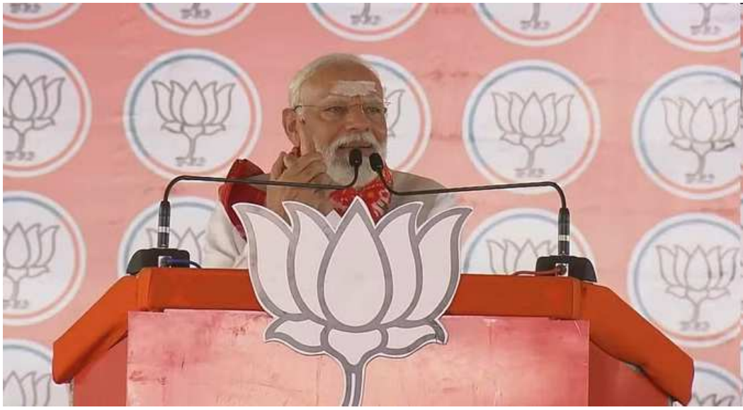
કરીમનગર,તા.૮ હાલ દેશમાં ચૂંટણીની મોસમ ચાલી રહી છે. અત્યાર સુધીમાં, ત્રણ તબક્કા દરમિયાન

કરીમનગર,તા.૮ હાલ દેશમાં ચૂંટણીની મોસમ ચાલી રહી છે. અત્યાર સુધીમાં, ત્રણ તબક્કા દરમિયાન ધણા રાજ્યોમાં મતદાન થયું છે અને હજુ ઘણા રાજ્યોમાં મતદાન થવાનું બાકી છે. આ સાથે ચૂંટણી પ્રચાર પણ જોરશરથી ચાલી રહ્યો છે. તેનું ઉદાહરણ વડાપ્રધાન નરેન્દ્ર મોદી છે. તેઓ આજે બે રાજ્યોમાં ત્રણ રેલી અને રોડ શોમાં હાજરી આપી હતી. તેલંગાણાના કરીમનગરમાં એક જનસભાને સંબોધિત કરતા વડાપ્રધાને કોંગ્રેસ અને વિપક્ષી ગઠબંધન પર જોરદાર નિશાન સાધ્યું હતું. પીએમ મોદીએ કહ્યું, 'ગઈકાલે દેશમાં ત્રીજા તબક્કાની ચૂંટણી પૂર્ણ થઈ ગઈ છે. ત્રીજા તબક્કામાં કોંગ્રેસ અને ભારતની ગઠબંધનનો ત્રીજો ફ્યૂઝ ફૂંકાયો છે. ચૂંટણીના હજુ ચાર તબક્કા બાકી છે. જનતાના આશીર્વાદથી ભાજપ અને એનડીએ ઝડપથી વિજય રથને આગળ લઈ જઈ રહ્યા છે. અહીં તમે પહેલાથી જ બીજા પક્ષો સાંસદની જીત સુનિશ્ચિત કરી લીધી છે. કોંગ્રેસની હાર અહીં એટલી નિશ્ચિત છે કે તે બહુ