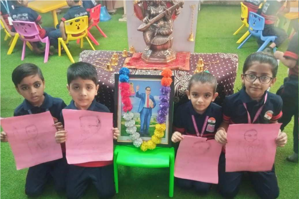
કમલપાર્ક, કુબેરનગર કોર્નર પાસે, વરાછા, સુરત સ્થિત અર્યાના વિદ્યા નિકેતન શાળા દ્વારા બાલભવનના ભૂલકાઓ અને શિક્ષકો દ્વારા આપણા બંધારણના ધરૂવેયા ભારતરત્ન બાબા સાહેબ આંબેડકરની જન્મ જયંતિની ઉજવણી કરી. આંબેડકરના જીવન આધારિત ચિત્રોમાં રંગકામ કરી બાબા સાહેબ આંબેડકરની પ્રતિમાને પુષ્પાંજલિ અર્પણ કરવામાં આવી સાથે-સાથે બાબા સાહેબના પહેરવેશમાં નાના-નાના ભૂલકાઓ આવી બાબા સાહેબના વિવિધ જીવન સૂત્રોનું ઉચ્ચારણ કર્યું.

રાષ્ટ્રીય બાળ અધિકાર સંરક્ષણ આયોગે ગતવર્ષે બોનવિટા બનાવતી કંપની મોનેલિજ ઈન્ટરનેશનલ ઈન્ડિયા લિ. ને નોટિસ પાઠવી હતી. જેમાં ઉલ્લેખ કર્યો હતો કે, આ પ્રોડક્ટમાં મોટાપ્રમાણમાં સુગર મળી આવી હોવાની ફરિયાદ છે. તેમજ તેમાં સામેલ અમુક સામગ્રી બાળકોના સ્વાસ્થ્ય માટે નુકસાનકારક છે. જેથી કંપનીને પોતાની પ્રોડક્ટની તમામ બ્રાન્ડ જાહેરાતો, પેકેજિંગ અને લેબલની સમીક્ષા કરી પરત લેવા આદેશ આપ્યો હતો. બોનવિટા સહિતના એનર્જી ડ્રિંક અને એનર્જી પાવર બાળકો માટે વાસ્તવમાં આરોગ્યપ્રદ છે કે નહિ, તેમાં પૂરતા પોષણ મળે છે કે નહિ તે અંગે નિષ્ણાતે જણાવ્યું છે કે, ચોકલેટ પાવરમાં નુકસાન પર કોઈ ખાસ રિસર્ચ થયું નથી.