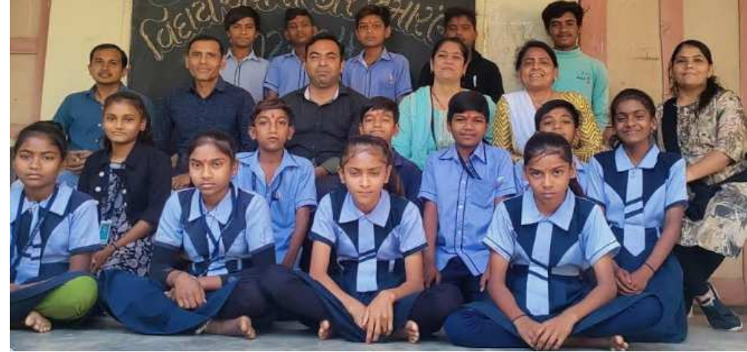
ખેડા જિલ્લાના કપડવંજ તાલુકામાં આવેલ જોરાપુરા પ્રાથમિક શાળા માં અભ્યાસ કરતા ધોરણ ૮ ના વિદ્યાર્થી ભાઈ બહેનો નો વિદાય સમારંભ યોજાઈ ગયો હતો. સમારંભની શરૂઆત સરસ્વતી વેદના પ્રાર્થના કરી કરવામાં આવી હતી. બાળકોએ સુંદર અભિનય વિદાય ગીત રજૂ કર્યું હતુ. ધોરણ આઠમાંથી વિદાય રહેલા વિદ્યાર્થીઓએ પોતાના પ્રતિભાવ રજૂ કર્યા હતા. આપસંગે એસ.એમ.સી સભ્યો, વાલીઓ હાજર રહ્યા હતા. સ્કૂલના શિક્ષકોએ બાળકોને આગળ ભણવા અંતર્ગત સમજ આપી તેમને આગળ વધવા માટે પ્રોત્સાહિત કરવામાં આવ્યા હતા.