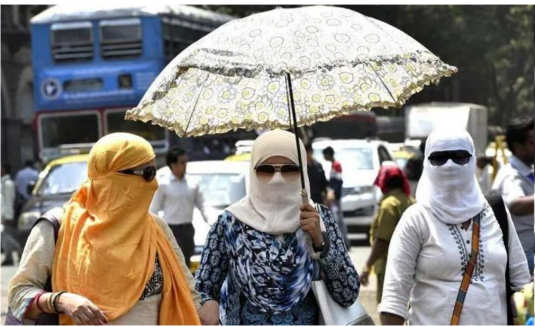
નવીદિલ્હી,તા.૨૮ જનજીવન મુશ્કેલ બન્યું છે. દેશભરમાં વધતી જતી તાપમાન ૪૦ ડિગ્રી સેલ્સિયસ ગરમી અને મોજાના કારણે અથવા તેનાથી વધુ સુધી પહોંચી રહ્યું છે. ભારતીય હવામાન વિભાગએ ઓડિશા અને પશ્ચિમ બંગાળમાં હીટ વેવને રેડ

એલર્ટ જાહેર કર્યું છે. જ્યારે બિહાર અને ઝારખંડ માટે ઓરેન્જ એલર્ટ જાહેર કરવામાં આવ્યું છે. વૈજ્ઞાનિકોનું કહેવું છે કે ગરમીનું મોજું આગામી ઘણા દિવસો સુધી ચાલુ રહેશે. હવામાન વિભાગના જણાવ્યા અનુસાર, ગરમ અને ભેજવાળા હવામાનને કારણે બંગાળ અને ઓડિશામાં દિવસનું મહત્તમ તાપમાન વધુ વધવાની શક્યતા છે. સાથે જ ગરમીના કારણે લોકોને ભારે હાવાકીનો સામનો કરવો પડશે. વધતી જતી ગરમી અને હીટવેવ અંગે ભારતીય હવામાન વિભાગના વરિષ્ઠ વૈજ્ઞાનિક સોમા સેન રોયે જણાવ્યું હતું કે, 'ઓડિશા પણ ગરમીના મોજાને કારણે ખરાબ સ્થિતિનો સામનો કરી રહ્યું છે. આવી જ સ્થિતિ કેટલાક દિવસો સુધી અહીં રહેવાની છે. તેથી રેડ એલર્ટ જાહેર કરવામાં આવ્યું છે. એવી ઘણી જગ્યાઓ છે જ્યાંનું તાપમાન ૪૦ ડિગ્રી સેલ્સિયસથી વધુ પહોંચી ગયું છે. પશ્ચિમ બર્ધમાન જિલ્લામાં આવેલા પનાગઢમાં શનિવારે પશ્ચિમ બંગાળનું મહત્તમ તાપમાન ૪૪.૬ ડિગ્રી સેલ્સિયસ નોંધાયું હતું, જ્યારે કોલકાતામાં દિવસનું મહત્તમ તાપમાન ૪૧.૧ ડિગ્રી સેલ્સિયસ નોંધાયું હતું. એટલું જ નહીં, મેદિનીપુરમાં ૪૩.૫, બાંકુરામાં ૪૩.૨, બેરકપુરમાં ૪૩.૨, બર્ધમાનમાં ૪૩, આસનસોલમાં ૪૨.૫, પુરુલિયામાં ૪૨.૭ અને