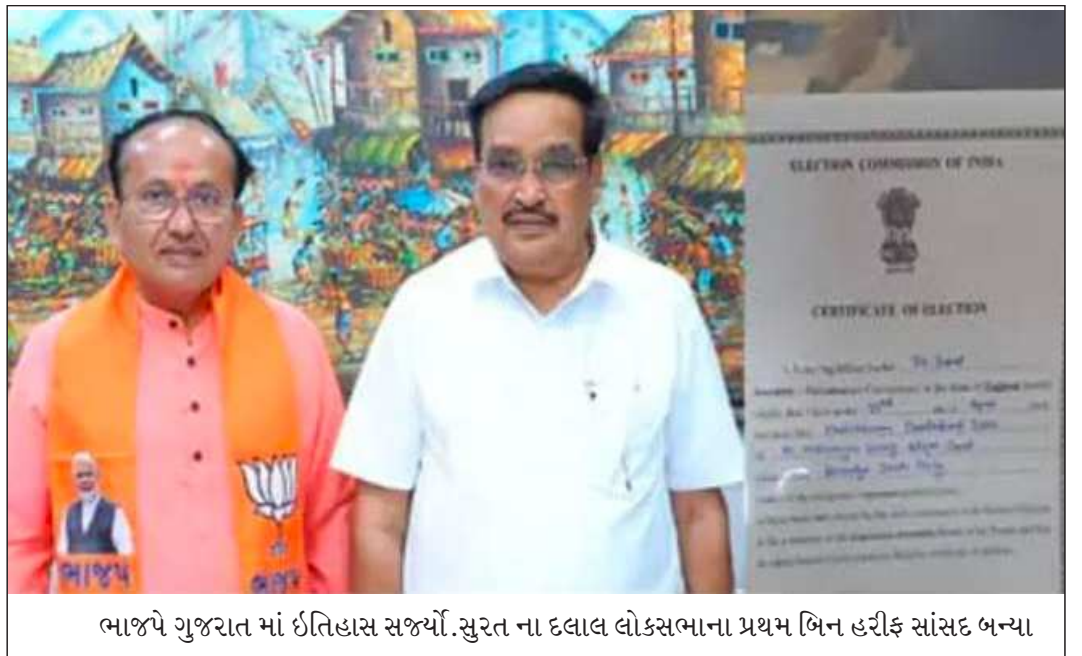
ભાજપે ગુજરાત માં ઈતિહાસ સર્જ્યો. સુરત ના દલાલ લોકસભાના પ્રથમ બિન હરીફ સાંસદ બન્યા

સુરતમાં કોંગ્રેસના ઉમેદવાર નિલેશ કુંભાણી અને ડમી ઉમેદવારનું ફોર્મ રદ થયાં બાદ હવે સુરતમાં ભાજપના ઉમેદવાર મુકેશ દલાલ સામે ૯ અપક્ષ કે અન્ય પક્ષના ઉમેદવાર રહે છે. આવતીકાલે ફોર્મ પરત ખેંચવાના દિવસે આ ઉમેદવારો ફોર્મ ખેંચી લે તો બિનહરીફ જાહેર થાય અને સુરત બેઠક પર ચૂંટણી ન થાય તેવી અટકળો ચાલી રહી છે. આવી અટકળો સાથે સાથે બે દિવસ પહેલા ગૃહમંત્રી અમિત શાહે ગુજરાતની ૨૫ બેઠકો બહુમતીથી જીતીશું તેવી એક ટિપ્પણી કરી હતી તે સુરતના રાજકારણમાં હોટ ટોપિક બની ગઈ છે. બે દિવસ પહેલાં ગુજરાતમાં ઉમેદવારી પત્રક ભરવા માટે આવેલા કેન્દ્રીય ગૃહમંત્રી અમિત શાહે એક ઈન્ટરવ્યુ આપ્યો હતો તેમાં તેઓએ ગુજરાતની ૨૫માંથી ૨૫ બેઠક વધુ બહુમતીથી જીતીશું તેવો દાવો કર્યો હતો. જોકે, ગુજરાતની ૨૬ બેઠક છે અને અમિત શાહ ૨૫ બેઠક માટે બોલ્યા હતા ત્યારે કઈ એક બેઠક તેઓ ભૂલી ગયાં કે એક બેઠક ભાજપ હારશે તેવી ટીપ્પણીઓનો મારો સોશયલ મિડિયામાં શરૂ થઈ ગયો હતો. જોકે, આજે સુરતમાં રાજકીય ડ્રામા થયો હતો અને કોંગ્રેસના ઉમેદવાર અને ડમી ઉમેદવારનું ફોર્મ રદ થયાં બાદ હવે અન્ય પક્ષો કે અપક્ષ ઉમેદવારી પાછી ખેંચે તો સુરત બેઠક પર ચૂંટણી નહી થાય તેવી અટકળો તેજ બની ગઈ છે. તેથી સુરતના રાજકારણમાં એવી ચર્ચા થઈ રહી છે કે ગૃહ મંત્રી ભુલથી ૨૫ બેઠક પર વધુ બહુમતીથી જીતીશું તેવો દાવો કર્યો હતો તે ભુલથી નહી પરંતુ પહેલેથી સુરતમાં ચૂંટણી ન થાય તેવું લાગતા તેઓએ ટિપ્પણી કરી હોવાની ચર્ચા જોરશોરમાં થઈ રહી છે.