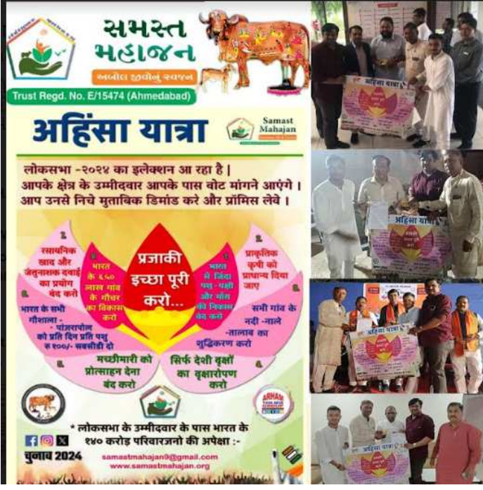
સહિતનાઓને મળી અહિંસા યાત્રાનું આવેદન પાઠવવામાં આવ્યું હતું. લોકસભાની ચુંટણી નજીક આવી રહી છે ત્યારે ઉમેદવારો પાસે લોકોને અબોલ પશુ, પશી, જળ, જંગલ અને સમગ્ર પર્યાવરણની સુરક્ષા