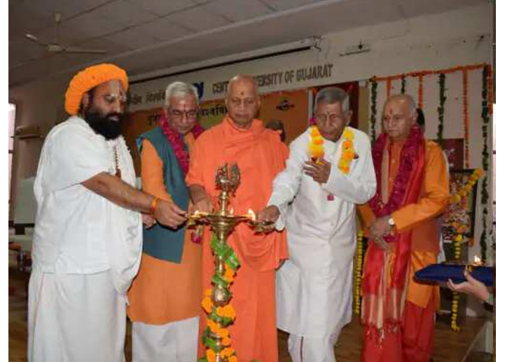
આપણે જીવનમાં સમયનું વિભાજન રાખવું જોઈએ. આપણા ધર્મમાં કોઈપણ પ્રકારનો પ્રતિબંધ નથી. અમે સમગ્ર વિશ્વને એક કરવા માટે કામ કર્યું છે.

સંસ્કૃતને મૂત ભાષા કહે છે પરંતુ સંસ્કૃત એકમાત્ર એવી ભાષા છે જે કોમ્પ્યુટર માટે શ્રેષ્ઠ છે. તેમણે કહ્યું કે અમારી વૈભવી શિક્ષણ પ્રણાલીથી અમને ગેરમાર્ગ દોરવામાં આવ્યા છે. ૧૯૭૬માં અંગ્રેજ શિક્ષણ લાગુ કરવામાં આવ્યું તે પહેલાં, અંગ્રેજોએ ૧૯૧૮ સુધીની તમામ શિક્ષણ પ્રણાલીનું સર્વેક્ષણ કર્યું અને તેને સમાપ્ત કરવાની યોજના બનાવી. તેમણે કહ્યું કે તે અમારી ગુરુકુળ પરંપરા છે. મેક્સ મુલરના પત્રનો ઉલ્લેખ કરતા તેમણે કહ્યું કે ભારતને કાયમ માટે ગુલામ બનાવવા માટે અહીંની શિક્ષણ વ્યવસ્થામાં ફેરફાર કરવો જરૂરી છે એવું મેકોલેએ કહ્યું હતું. તેમણે કહ્યું કે ભારતની ધરતીનો સોનેરી ઈતિહાસ છે. તેમણે કહ્યું કે હવે ભારત સોનાની ચીડિયા નહીં પણ સોનાનો સિંહ બનીને ઊભું રહેશે. આપણે ભારતીયતા પર ગર્વ અનુભવવો જોઈએ. વિશ્વની તમામ સંસ્કૃતિઓ નાશ પામી છે. પરંતુ ભારતની સંસ્કૃતિ અમીટ છે. આપણી સંસ્કૃતિને માનવ કલ્યાણ માટે ઘણું આપ્યું છે. ભારતના ઋષિમુનિઓએ માનવજાતનું સંચાલન શીખવ્યું છે. તેમણે વધુમાં જણાવ્યું હતું કે જ્ઞાન શક્તિ અને ક્રિયા શક્તિ ઈશ્વર શક્તિને અનુસરે છે. આપણી ઈશ્વરનો હોવી જોઈએ. મહાન બનવા માટે ઈશ્વરનો હોવી જોઈએ.