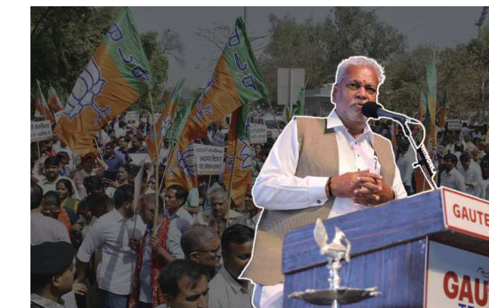
માંગરોળ તાલુકાનાં ગામડાઓમાં રૂપાલાનો વિરોધ થયો હતો. ઉલ્લેખનીય છે કે, સુરેન્દ્રનગરમાં પાટીદાર સમાજ પુરશોત્તમ રૂપાલાનાં સમર્થનમાં આવ્યો છે. સુરેન્દ્રનગરમાં પરશોત્તમ

રાજકોટ લોકસભા બેઠક પરથી ભાજપના ઉમેદવાર પરશોત્તમ રૂપાલાના નિવેદનને કારણે શરૂ થયેલો વિવાદ શાંત થવાનું નામ નથી લઈ રહ્યો. રૂપાલા સામે ક્ષત્રિય સમાજનો રોષ યથાવત. રાજ્યમાં અનેક ગામોમાં રૂપાલા અને ભાજપનાં કાર્યકરોને ગામમાં પ્રવેશ બંધીનાં બેનર લગાવ્યા છે. જો કે, સુરેન્દ્રનગરમાં પાટીદાર સમાજ પુરશોત્તમ રૂપાલાનાં સમર્થનમાં આવ્યો છે. વડોદરાનાં ડાબોઈ તાલુકામાં ક્ષત્રિય સમાજ દ્વારા રૂપાલાનો વિરોધ કરવામાં આવી રહ્યો છે. સાકોદ ગામમાં ભાજપ કાર્યકરોનાં પ્રવેશ પર પ્રતિબંધનાં બેનરો લાગ્યા છે. જે સીબીની મદદથી ગામમાં મુખ્ય પ્રવેશ દ્વાર પર ક્ષત્રિય સમાજે બેનરો લગાવ્યા છે. આ ઉપરાંત સુરતનાં ગ્રામ્ય વિસ્તારમાં રૂપાલાનાં વિરોધમાં બેનર લાગ્યા છે. રૂપાલાની ટિકિટ ન કપાય તો ભાજપને પ્રવેશ નહીંનાં બેનર લાગ્યા છે. તેમજ ભાજપનાં કોઈ પણ નેતાને ગામમાં પ્રવેશ ન કરવાના પણ બેનર લગાવવામાં આવ્યા છે. ઓલપાડ અને