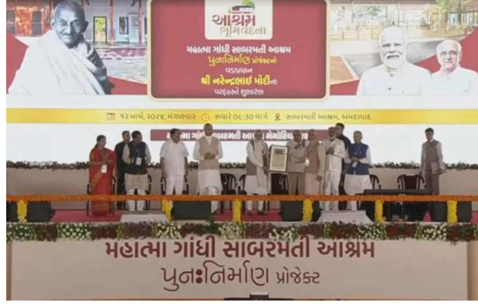
ભારતીય જનતા પાર્ટી ગુજરાત પ્રદેશ મીડિયા વિભાગ એક અખબારી યાદીમા જણાવે છે કે, આજ રોજ દેશના વડાપ્રધાનશ્રી નરેન્દ્રભાઈ મોદી એક દિવસ ગુજરાત પ્રવાસે પધાર્યા છે. ગુજરાતના પનોતા પુત્ર અને વૈશ્વિક નેતાશ્રી નરેન્દ્રભાઈ મોદી

સાહેબ જ્યારે જ્યારે ગુજરાત પ્રવાસે પધારે છે ત્યારે ગુજરાતને વિકાસના કાર્યોની ભેટ આપે છે જેમા દેવાલય, રોડ-રસ્તા સહિતના ઇન્ફ્રાસ્ટ્રક્ચરના કાર્યોની ભેટ આપતા હોય છે ત્યારે આજરોજ મહાત્મા ગાંધી સાબરમતી આશ્રમ પુનઃનિર્માણ પ્રોજેક્ટનો શુભારંભ વડાપ્રધાનશ્રી નરેન્દ્રભાઈ મોદી સાહેબના હસ્તે કરવામા આવ્યો. આ કાર્યક્રમમા રાજ્યના મુખ્યમંત્રીશ્રી ભુપેન્દ્રભાઈ પટેલ તેમજ રાજ્યના રાજ્યપાલશ્રી દેવવ્રત આચાર્યજી અને પ્રદેશના અધ્યક્ષના સી.આર.પાટીલજી ઉપસ્થિત રહ્યા હતા. આ કાર્યક્રમમા વડાપ્રધાનશ્રી નરેન્દ્રભાઈ મોદી સાહેબ સહિત ઉપસ્થિત સૌએ વૈષ્ણવજન તો તેને રે કહીએ રે ભજન સાભળ્યું. વડાપ્રધાનશ્રી નરેન્દ્રભાઈ મોદી સાહેબે સંબોધન કરતા જણાવ્યું કે, સાબરમતી આશ્રમ હંમેશા એક અપ્રતિમ ઉર્જાનું જીવંત કેન્દ્ર રહ્યું છે. જ્યારે અંહી આવીએ છીએ ત્યારે બાપુની પ્રેરણાનો આપણે અનુભવ કરી શકીએ છીએ. સાબરમતી આશ્રમ સત્ય અને અહિંસાના આદર્શો, રાષ્ટ્ર આરાધનાનો સંકલ્પ, ગરિબ, વંચિતની સેવામા નારાયણ સેવા કરવાનો ભાવ સહિતના મુલ્યોને આજે પણ જાળવી રાખ્યા છે. શ્રી મોદીજીએ જણાવ્યું કે, આ મારું સૌભાગ્ય છે કે સાબરમતી આશ્રમના પુનઃવિકાસ અને વિસ્તારના કાર્યોનું શિલાન્યાસ કરવાની તક મળી. કોચરબ આશ્રમનો પણ વિકાસ કરવામા આવ્યો છે આજે તેના કાર્યોનું પણ લોકાર્પણ કરવામા આવ્યું છે. સાઉથ આફ્રિકાથી