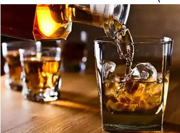
શકાશે નહીં તેવી સ્પષ્ટતા ચૂંટણી પંચે કરી હતી.