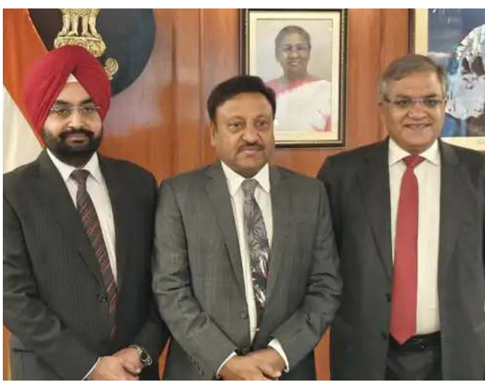
પસંદગી કરવામાં આવી હતી. અરજીઓ અને અનિશ્ચિતતાની સ્થિતિ સર્જશે. અમે વચગાળાના આદેશ દ્વારા આને રોકી શકતા નથી. નવા ચૂંટણી કમિશનરો સામે કોઈ આરોપ નથી. સુપ્રીમ

(એઆર.એલ), ૨૧ સુપ્રીમ કોર્ટે ગુરુવારે નવા ચૂંટણી કમિશનરની નિમણૂક પર સ્ટે મૂકવાની માંગ કરતી અરજીઓ ફગાવી દીધી હતી. ન્યાયમૂર્તિ સંજીવ બક્ષા અને દીપાંકર દત્તાની બેન્ચે જણાવ્યું હતું કે તે મુખ્ય ચૂંટણી કમિશનર અને અન્ય ચૂંટણી કમિશનરો (નિમણૂક, સેવાની શરતો) અને ઓફિસની શરતો) એક્ટ, ૨૦૨૩ની માન્યતાને પડકારતી મુખ્ય અરજીઓ પર ધ્યાન આપશે. સુપ્રીમ કોર્ટે કહ્યું કે તે ચૂંટાયેલા ચૂંટણી કમિશનરોની યોગ્યતા પર સવાલ ઉઠાવી રહી નથી, પરંતુ તે પ્રક્રિયા પર સવાલ ઉઠાવી રહી છે જેના હેઠળ