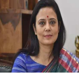
હિરાનંદાની પાસે ગીરો મૂકી દીધી. તેમણે સત્યમેવ જયતે પણ લખ્યું હતું. બીજેપી સાંસદ નિશિકાંત દુબે અગાઉ પણ આવો દાવો કરી ચુક્યા છે. ગયા વર્ષે નવેમ્બરમાં તેણે ૬ પર પોસ્ટ કરીને આવો જ દાવો કર્યો હતો. તે સમયે તેમણે લખ્યું હતું કે લોકપાલે રાષ્ટ્રીય સુરક્ષાને ગીરો કરીને બ્રહ્મચારના આરોપી સાંસદ મહુઆ મોઈત્રા સામે સીબીઆઈ તપાસનો આદેશ આપ્યો છે. તે જ સમયે, મોઈત્રાએ તેમના પર વળતો પ્રહાર કર્યો હતો અને કહ્યું હતું કે પીએમ મોદીનો લોકપાલ હજુ પણ અસ્તિત્વમાં છે અને હજુ પણ સક્રિય છે.

સાંસદ મહુઆ મોઈત્રાની મુશ્કેલીઓમાં વધારો થયો છે. લોકસભામાંથી હાંકી કાઢવામાં આવેલા સાંસદ મહુઆ મોઈત્રા સામે કેશ ફોર ક્વેરી કેસમાં લોકપાલે સીબીઆઈને તપાસ કરવાનો આદેશ આપ્યો હતો. એવું કહેવામાં આવી રહ્યું છે કે સીબીઆઈ ટૂંક સમયમાં આ મામલે એફઆઈઆર નોંધશે. લોકપાલે સીબીઆઈને મહુઆ મોઈત્રા વિરુદ્ધ બ્રહ્મચાર વિરોધી અધિનિયમ હેઠળ કેસ નોંધીને તપાસ કરવાનો નિર્દેશ આપ્યો છે. આ સાથે લોકપાલે તપાસ એજન્સીને છ મહિનામાં પોતાનો રિપોર્ટ સોંપવા માટે કહ્યું