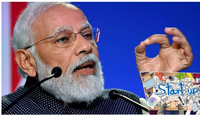
લોકો વિચારે છે કે તેઓ તેને હમણાં માટે છોડી દેશે અને જ્યારે નવી સરકાર આવશે, ત્યારે તેઓ તે મુજબ જોશે. પરંતુ આજે તમે આટલી મોટી સંખ્યામાં અહીં આવ્યા છો, તો તમારા મનમાં તમે જાણો છો કે આગામી ૫ વર્ષમાં શું થવાનું છે. વડાપ્રધાને કહ્યું, 'આજે ભારત વિશ્વમાં ત્રીજું સૌથી મોટું સ્ટાર્ટઅપ ઈકોસિસ્ટમ છે. ભારતમાં આજે ૧.૨૫ લાખ

વડાપ્રધાન નરેન્દ્ર મોદી દિલ્હીના પ્રગતિ મેદાનમાં આયોજિત સ્ટાર્ટઅપ મહાકુંભમાં પોતાનું સંબોધન આપી રહ્યા છે. પીએમ મોદીએ તેમના સંબોધનમાં કહ્યું, 'છેલ્લા દાયકાઓમાં, અમે જોયું છે કે ભારતે આઈટી અને સોફ્ટવેર ક્ષેત્રમાં એક છાપ છોડી છે. હવે આપણે જોઈ રહ્યા છીએ કે ઈનોવેશન અને સ્ટાર્ટઅપ કલ્ચરનો ટ્રેન્ડ સતત વધી રહ્યો છે. આ મહાકુંભમાં સ્ટાર્ટઅપ જગતના તમામ મિત્રો હાજર રહે તે જરૂરી છે. સામાન્ય રીતે, જ્યારે ચૂંટણી આવે છે, ત્યારે વેપારી