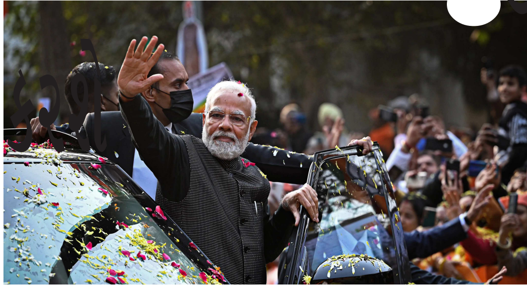
અમદાવાદ, તા. ૧૧ વડાપ્રધાન નરેન્દ્ર મોદી મંગળવારે ૧૨ માર્ચ ૨૦૨૪ એટલે કે કાલે દાંડીકૂચ દિવસ નિમિત્તે અમદાવાદમાં 'આશ્રમ ભૂમિ વંદના' કાર્યક્રમમાં સામેલ થશે અને 'મહાત્મા ગાંધી સાબરમતી આશ્રમ પુનઃનિર્માણ પ્રોજેક્ટ'નો શુભારંભ કરશે. આ આશ્રમ આઝાદીની ચળવળ દરમિયાન ગાંધીજી સાથે દેશ અને દુનિયાભરના નેતાઓની મંત્રણાનો સાક્ષી રહ્યો છે, સાથે જ આ આશ્રમ ગાંધીજીના ઉચ્ચ આદર્શો, મૂલ્યો અને સાદગીભર્યા

જીવનનો પણ સાક્ષી રહ્યો છે. 'આશ્રમભૂમિ વંદના' ના આ સમારોહમાં ગુજરાતના મુખ્યમંત્રી શ્રી ભૂપેન્દ્ર પટેલ પણ હાજર રહેશે. ગાંધીજીએ દક્ષિણ આફ્રિકાથી ભારત પરત આવ્યા બાદ ૧૯૧૭માં અમદાવાદમાં સાબરમતી નદીના કિનારે આ આશ્રમનો પાયો નાખ્યો હતો. ભારતીય ઇતિહાસના એક મહત્વપૂર્ણ અધ્યાય તરીકે સાબરમતી આશ્રમ આઝાદીની ચળવળનું એક મુખ્ય કેન્દ્ર રહ્યો છે. આ સ્થળની સાદગી અને પવિત્રતાને જોઈને વિશ્વાસ કરવો મુશ્કેલ છે કે અહીં દુનિયા પર રાજ કરનારા અંગ્રેજોને ભારત છોડવા માટે મજબૂર કરી દેનારા