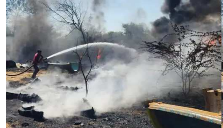
જેનાં પગલે ગાંધીનગર ફાયર બ્રિગેડને બોલવવામાં આવી હતી. આગનો કોલ મળતા જ ફાયર બ્રિગેડની ટીમે તાત્કાલિક

ગાંધીનગરના રાંધેજા રોડ ઘૂંઘટ હોટલ નજીક આવેલા ખેતરમાં કોઈ અગમ્ય કારણોસર ભીષણ આગ લાગી હતી. જેનાં કારણે ખેતરમાં રાખેલ વોટરપાર્કની રાઈડ્સનો સામાન બળીને ભસ્મીભૂત થઈ ગયો હતો. બનાવની જાણ થતાં સુધી જોવા મળી રહી હતી. અચાનક આગ લાગતા ખેતરમાં હાજર લોકોમાં ફફડાટ વ્યાપી ગયો હતો. પ્રારંભિક તબક્કે આગને ઓલવવાનાં પ્રયાસો કરવામાં આવ્યા હતા. પરંતુ વોટરપાર્કની રાઈડ્સ સહિતનો સર સામાન જોતજોતામાં વિકરાળ આગ પકડી લીધી હતી સામાન રાખવામાં આવેલો હતો. આજે અચાનક જ ખેતરમાં પડેલા સર સામાનમાં અચાનક આગ ભભૂકી ઉઠી હતી. અને જોતા જોતામાં વોટરપાર્કની રાઈડ્સનો સામાન ભડભડ સળગવા માંડ્યો હતો. જેની જવાબાઓ દૂર દૂર સુધી જોવા મળી રહી હતી. અચાનક આગ લાગતા ખેતરમાં હાજર લોકોમાં ફફડાટ વ્યાપી ગયો હતો. પ્રારંભિક તબક્કે આગને ઓલવવાનાં પ્રયાસો કરવામાં આવ્યા હતા. પરંતુ વોટરપાર્કની રાઈડ્સ સહિતનો સર સામાન જોતજોતામાં વિકરાળ આગ પકડી લીધી હતી