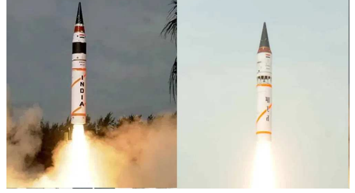
માટે દુઃસ્વપ્નથી ઓછા નથી, પરંતુ અગ્નિ મિસાઈલ એ અત્યાધુનિક ટેક્નોલોજીથી સજ્જ યુદ્ધ સૈનિક છે જે દૂરના દુશ્મનને મિનિટોમાં જ ખતમ કરી શકે છે. કેમ ખાસ છે અગ્નિ મિસાઈલ? આ મધ્યવર્તી અંતરની બેલેસ્ટિક મિસાઈલ છે. સૌથી મોટી બાબત પરમાણુ શસ્ત્રો વહન કરવામાં સક્ષમ છે, આ મિસાઈલ પર ન્યુક્લિયર બોમ્બ પણ ફીટ કરી શકાય છે, આ મિસાઈલમાં થર્મોબેરિક હથિયારો પણ લગાવી શકાય છે.

ભારતની પાસે ઘણી એવી મિસાઈલો છે, જેના કારણે દુશ્મન દેશ ટેન્શનમાં રહે છે. ભારતની પાસે અગ્નિ સિરિઝની ૧થી લઈને અગ્નિ પસુધીની મિસાઈલ પાવર છે પમ હિન્દુસ્તાન આ મિસાઈલોમાં નવી ટેક્નિકનો ઉપયોગ કરવા ઈચ્છે છે જેથી એક્ચુરેસી અને ઝડપમાં વધારો કરવામાં આવે. સૂત્રો દ્વારા મળતી માહિતી મુજબ ભારત અગ્નિ સિરિઝની બેલેસ્ટિક મિસાઈલના પરીક્ષણની તૈયારી કરી રહ્યું છે. આ ડિઝાઇન તટની પાસે એપીજે અબ્દુલ કલામ દ્વીપ પરથી અગ્નિ મિસાઈલનો ટેસ્ટ થશે. સૂત્રો દ્વારા મળતી માહિતી મુજબ આ પરીક્ષણ ૧૧ અને ૧૬ માર્ચની વચ્ચે ક્યારેય પણ થઈ શકે છે. એટલે કે ૪૮ કલાક બાદ કોઈ પણ સમયે ભારતની અગ્નિ શક્તિનું વીડિયો ટ્રેલર રિલિઝ થઈ શકે છે. પરીક્ષણ માટે બંગાળની ખાડીમાં ૩૫૦૦ કિલોમીટર રેન્જમાં નો ફ્લાય ઝોન જાહેર કરવામાં આવ્યો છે. સંભાવના છે કે આ પરીક્ષણમાં ૩ મિસાઈલોમાંથી કોઈ એક કે બે કે ત્રણનું પરીક્ષણ થશે. જે મિસાઈલોનું પરીક્ષણ થવાનું છે, તેમાં અગ્નિ-૩, અગ્નિ-૪ અને સભમરીનથી લોન્ચ થનારી કે-૪ મિસાઈલ છે. ભારત પાસે એવા ઘાતક શસ્ત્રો છે જેના નામ દુશ્મનો