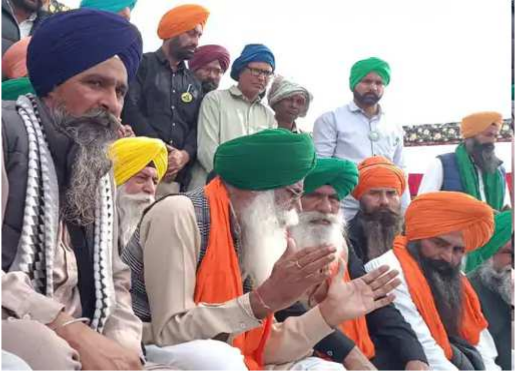
પંજાબ-હરિયાણાની શંભુ-ખનોરી બોર્ડર પર આંદોલન કરી રહેલા ખેડૂતો દ્વારા માર્ચે દિલ્હી તરફ કૂચ કરશે. ૧૦ માર્ચે બપોરે ૧૨ વાગ્યાથી સાંજના ૪ વાગ્યા સુધી દેશભરમાં

ટ્રેનો પણ બંધ રહેશે. આ જાહેરાત રવિવાર (૩ માર્ચ)ના રોજ ભટિંગામાં શુભકરણ સિદ્ધની