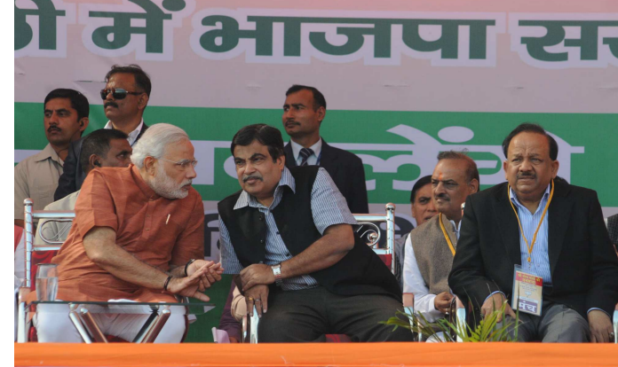
વખત વિધાનસભાની ચૂંટણી અને બે વખત સંસદની ચૂંટણી જીત્યો હતો. મેં દેશના પુબ જોરદાર માજિનથી વિજય મેળવ્યો છે અને પક્ષમાં અને સરકારમાં મહત્વના હોદ્દા સંભાળ્યા છે. રાજ્ય અને કેન્દ્ર

લોકસભા ચૂંટણી માટે ભાજપે ઉમેદવારોની પ્રથમ યાદી જાહેર થતા જ કેટલાક નેતાઓની નારાજગી સામે આવી રહી છે. ગૌતમ ગંભીર અને જયંત સિન્હાએ યાદી જાહેર થતા પહેલા જ સક્રિય રાજકારણથી દૂર રહેવાની વિનંતી કરી હતી. ત્યારે હવે યાદી જાહેર થયા બાદ ડૉ. હર્ષવર્ધને પણ રાજનીતિથી સંન્યાસ લેવાની વાત કરી છે. તેમણે ટ્વિટર દ્વારા એક લાંબી પોસ્ટ કરીને આ માહિતી આપી છે. ડૉ. હર્ષવર્ધને જાહેરાત કરી છે કે તેઓ રાજકારણને અલવિદા કહી રહ્યા છે. તેમણે ૬ પર લખ્યું કે 'રાજકારણમાં મારી ૩૦ વર્ષની કારકિર્દી ઘણી સફળ રહી છે. આ દરમિયાન હું પાંચ