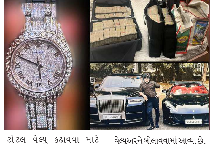
ટોટલ વેલ્યુ કઢાવવા માટે વેલ્યુઅરને બોલાવવામાં આવ્યા છે.