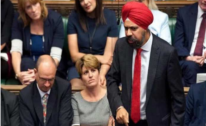
ખેડૂત આંદોલનમાં બ્રિટિશ સાંસદો પણ ચંચૂપાત કરવા માંડ્યા છે.

લંડન, તા. ૨૩ ભારતમાં નવેસરથી શરૂ થયેલા ખેડૂત આંદોલનના પડઘા બ્રિટનની સંસદમાં પણ પડ્યા છે. આંદોલનકારી ખેડૂતો અને સરકાર વચ્ચેની વાટાઘાટો હજી સુધી સફળ થઈ નથી. તેમાં પણ બુધવારે એક યુવકનું ગોળી વાગવાથી મોત થયું હોવાના કારણે આંદોલન વધારે ભડક્યું છે. જોકે આ યુવકનું મોત પોલીસ ફાયરિંગમાં થયું હોવાનો પોલીસે ઈનકાર કર્યો છે. હવે ભારતના