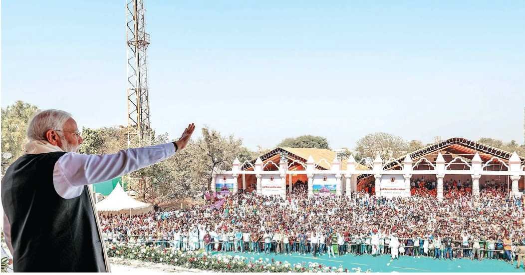
મહેસાણા, તા. ૨૩

મહેસાણાના શિવધામ શ્રી વાળીનાથ અખાડા તરબ ખાતે નૂતન ભવ્ય મંદિરમાં મહાશિવલિંગની સ્થાપના અને સુવર્ણશિખર પ્રાણપ્રતિષ્ઠા મહોત્સવ પ્રસંગે દર્શન-પૂજન બાદ વડાપ્રધાન નરેન્દ્ર મોદીએ ૧૩, ૬૦૧ કરોડનાં વિકાસકામોનું લોકાર્પણ-ખાતમહૂર્ત કરતાં જણાવ્યું હતું કે, ભારતની વિકાસયાત્રાનો વર્તમાન કાલખંડ ખૂબ જ મહત્વપૂર્ણ બની રહ્યો છે. જ્ય વાળીનાથ કલ્હને હિંગળાજ માતાજી અને ભગવાન શ્રી દત્તાત્રેયની જય બોલાવીને