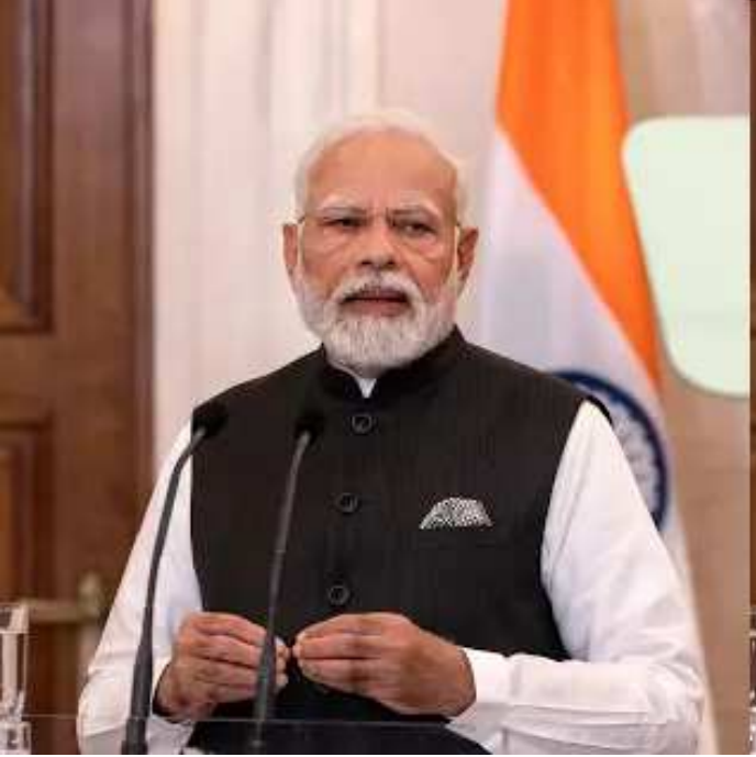
નવીદિલ્હી,તા.૨૮ આજે વડાપ્રધાન મોદીએ મન કી બાત કાર્યક્રમના ૧૦૮મા પીએમ મોદી લોકો સાથે રૂબરૂ જમા

હતા. કાર્યક્રમની શરૂઆતમાં તેમણે કહ્યું કે અમૃતકાલમાં નવો ઉત્સાહ, નવી લહેર છે. આ વર્ષે બંધારણને પણ ૭૫ વર્ષ પૂરા થયા અને સુપ્રીમ કોર્ટે પણ ૭૫ વર્ષ પૂરા કર્યા. તેમણે કહ્યું કે બંધારણની મૂળ નકલના ત્રીજા અધ્યાયમાં લોકોના મૂળભૂત અધિકારોનું વર્ણન કરવામાં આવ્યું છે. રસપ્રદ વાત એ છે કે ત્રીજા અધ્યાયની શરૂઆતમાં ભગવાન રામ, માતા સીતા અને લક્ષ્મણના ચિત્રોને સ્થાન આપવામાં આવ્યું છે. બંધારણના ઘડવૈયાઓ માટે પણ તે પ્રેરણાનો સ્રોત હતો.